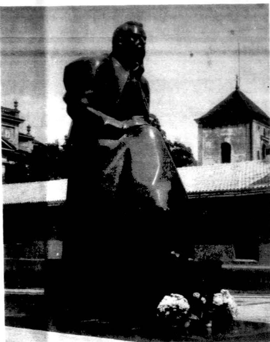
Jonas Mačiulis-Maironis, Lietuvos universiteto profesorius ir literatūros katedros garbės dekanas, dėstęs lietuvių literatūrą Lietuvos universitete. Maironis mums geriau pažįstamas kaip iškilusis tautos dainiuos-poetas.

Neišmintingosioms nereikia cukraligės, kad jų pėdos skaudėtų: jos pačios savas kojas vargina. Tik 34 procentai moterų dėvi patogią avalynę ir džiaugiasi pėdomis nesisuk-damos. Tuo tarpu, dėvėdamos nehi-gieniškus batelius, „Oi, kaip man gelia tas pėdas“, skundžiasi: 1. 36% jų, nes nori geriau atrodyti; 2. 19%, nes mano, kad tuomi jos esti vyrams patrauklesnės; 3. 16%, nes tarsi kitoms moterims sudarancios didesnį įspūdį; 4. 5% — neturi pasirinkimo: visokia avalynė jų pėdas vargina. (Šaltinis: Opinion Research Corporation for Easy Spirit — apklauskite 504 moteris).