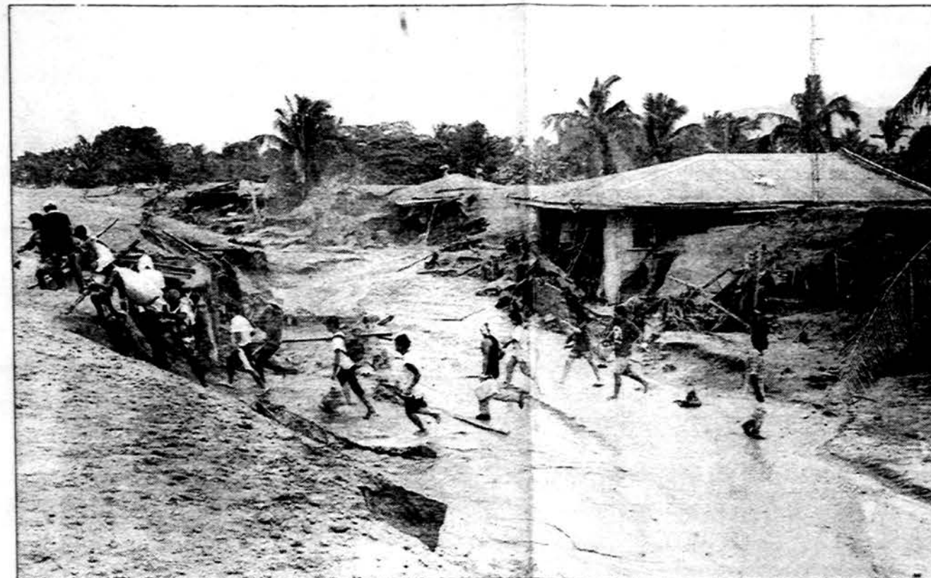
Perspėjus Pinatubo ugniakalnio papėdėje esančio kaimo žmones, kad vėl numatomas didelis ugniakalnio išsiveržimas, žmonės palikę savo namus bėga į saugia vieta. Sekmadienį atstūmę žmonės buvo užmušti iš ugniakalnio išsiveržusių ir „lietumi“ lijučių degančių pelenų.

Lietuvos, Latvijos ir Estijos karinių štabų atstovų konferencija prasideda Vilniuje rugpjūčio 31 d. Joje dalyvaus ir NATO —