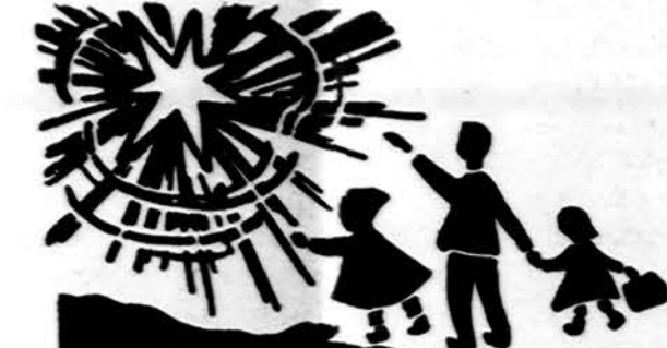
Redaguoja J. Placas. Medžiagą siųsti: 3206 W. 65th Place, Chicago, IL 60629

x Lietuvių Vyčių 36 kuopos susirinkimas bus rugšėjo 21 d., pirmadienį, Nekalto Prasidejimo Brighton Parko parapijos salėje. Kai kurie nariai gaus pirmąjį ir antrąjį laipsnius. Visus narius kviečiame dalyvauti.