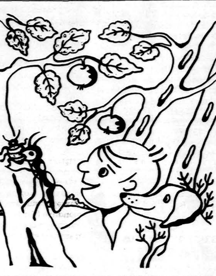
Algis seka skruzdę. O ką skruzdė neša, sužinosite paskaitę A. Gustaičio knygutę vaikus „Sodininkai“.

Išleistas Lietuvių Mokytojų Sąjungos Chicago skyriaus