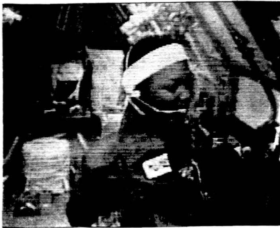
Astronautė Mae Jamison Endeavour erdvėlaivio laboratorijoje.

Lebano prez. Elias Hrawi ir Sirijos prez. Hoafez al-Assad sekmadienį užbaigė dvi dienas trukusius pasitarimus, tačiau nebuvo užsiminta apie greitą Sirijos kariuomenės atitraukimą iš užimtų vietovių. Tuo tarpu Izraelio vyriausybė apkalta iš užimtų vietovių. Tuo tarpu Izraelio vyriausybė apkalta iš užimtų vietovių. Tuo tarpu Izraelio vyriausybė apkalta iš užimtų vietovių.