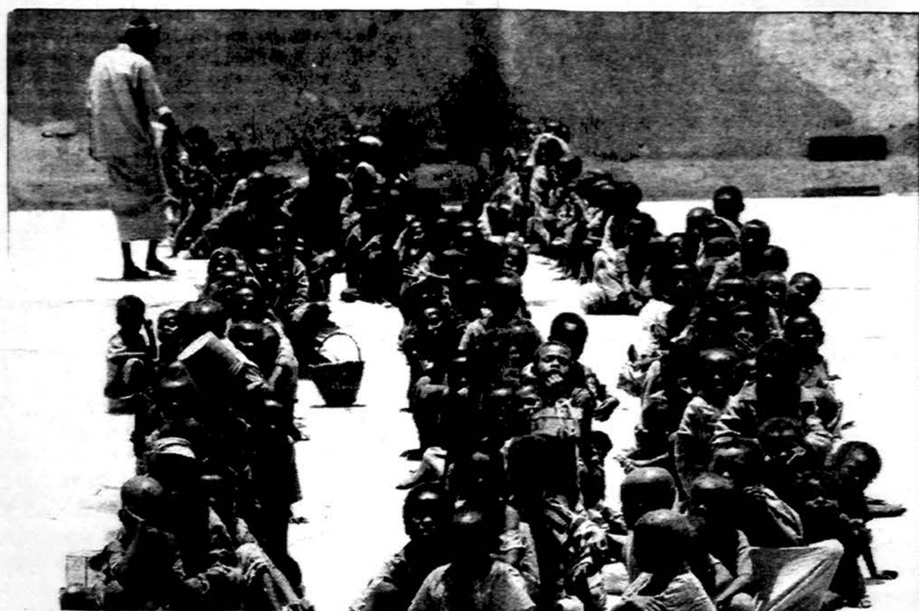
Somalijoje vaikai susodinti eilėmis ir laukia atvežamo maisto. Nors tarptautinės pagalbos siunttos atvežamos kasdien, maisto nepakanka badaujantiems gyventojams ir daugelis lieka alkani.

Lietuva realiai tikisi gauti iš Vokietijos vyriausybės 500