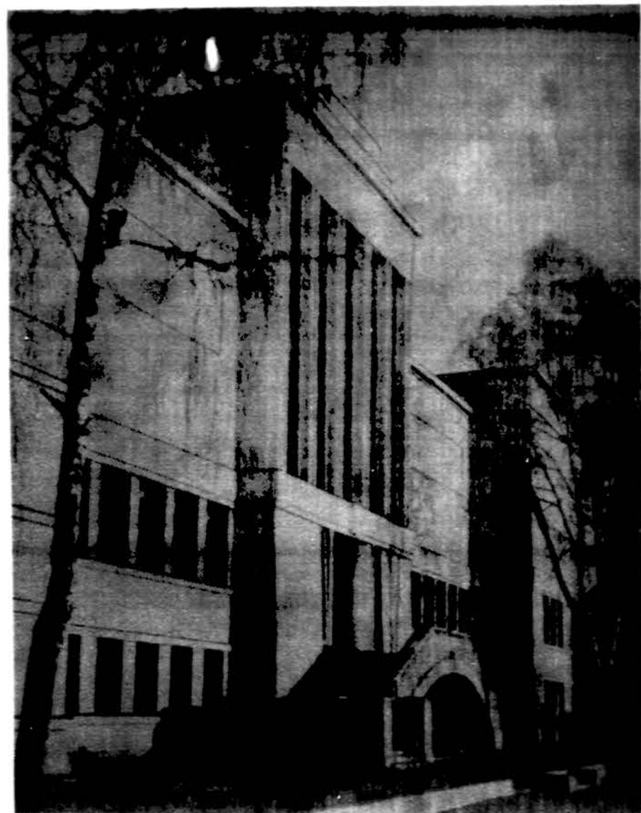
Vytauto Didžiojo muziejus Kaune.

Dabartinis parlamentas yra išrinktas senąja komunistine tvarka. Jo sąstata nėra nei vieno žemdirbio, ūkininko ar nors žemės ūkio darbininko. Tad sa-