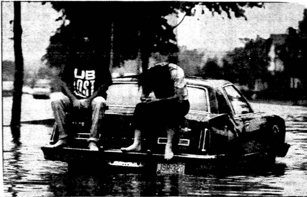
Šią savaitę kelis kartus siautusias liūtys sukėlė potvynių pavojų Iova, Michigan, Illinois ir Wisconsin valstijose. Čia du Fond Du Lac, WI vairuotojai, su savo automobiliu patekę į staigaus lietaus sukeltą potvynį. Tokių scenų pastaruoju metu pasitaikė nemažai.

Kaune, Lietuvos energetikos institute, prasidėjo dviejų dienų tarptautinis seminaras „Efektyvūs energijos naudojimas“. Seminare dalyvauja ir konsultuoja JAV firmų atstovai, didelę gru-