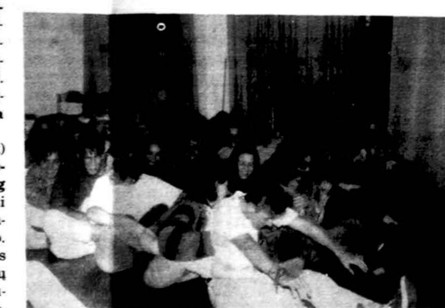
Susipažinimo vakaras Vasario 16 gimnazijoje.

Visa publika šiuo aukšto lygio koncertu buvo labai patenkinta. Koncertui pasibaigus net visi reikė padėką skardžiais plojimais. Juk retai tenka girdėti taip tyro, skambaus, giliai išlavinto balso tokį lengvą skambėjimą, lydimą scenos gestais, mimika, jautimu išbalsuojimu, perteikimo nuosirvumu. Po koncerto publika dar turėjo malonumų su soliste pabendrauti bendrose vaišėse kavinėje. Gausiai buvo gelėmus