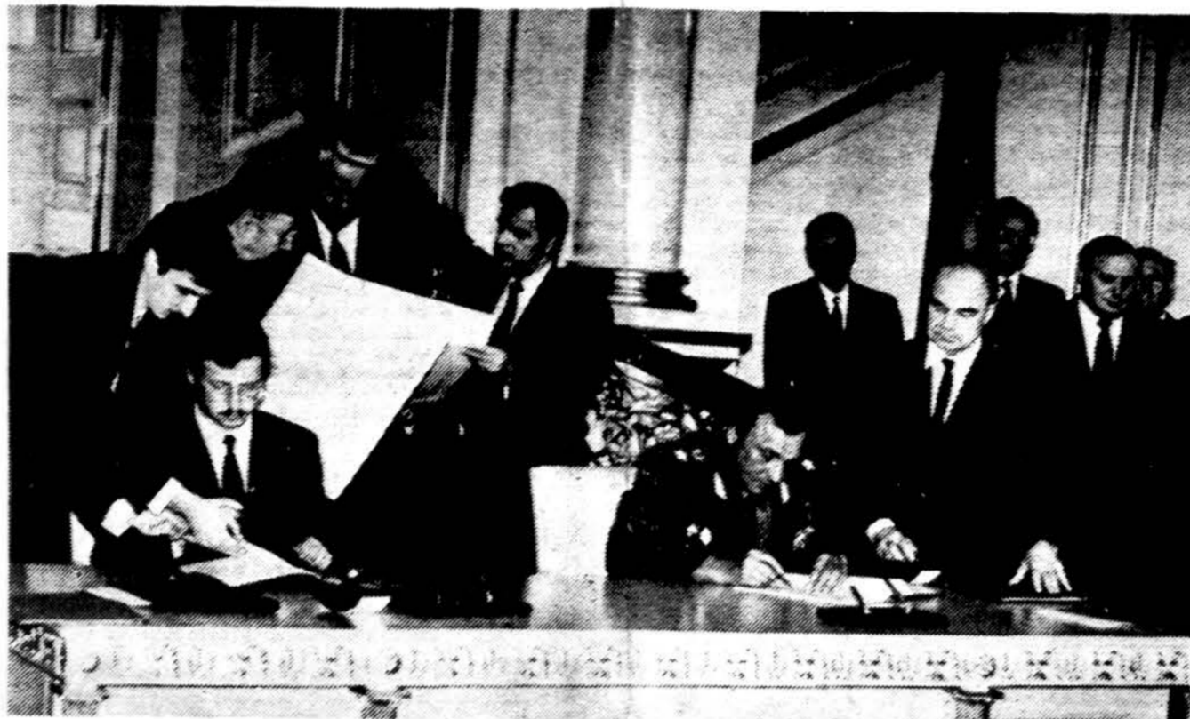
Lietuvos Gynybos ministras Audrius Butkevičius (kairėje) ir Rusijos gynybos ministras Pavel Gračev rugsėjo 8 d. Maskvoje pasirašo sutartį dėl rusų dalinių visiško išvedimo iš Lietuvos iki 1993 m. rugpjūčio 31 d. Už jų matyti Lietuvos AT pirm. Vytautas Landsbergis ir Rusijos prezidentas Boris Jelcin, besitariantys apie kitus dokumentus. Maskvos televizija šį pasirašymą komentavo: „Sensacijos nebuvo“. Nors sutartimi sutarta dėl datos, kada paskutinis Rusijos karys apleis Lietuvos teritoriją, nepasirašyta politinė sutartis, nes abi šalys pripažino, kad dar nepakankamai pasirašyta.

Pagal valstybinės kalbos įstatymą dar pavasarį Vyriausybė priėmė nutarimą, nurodantį pareigas, kurias einantys žmonės privalo mokėti lietuvių kalbą. Išskirtos trys kategorijos. Mažiausi reikalavimai keliami asmenims, dirbantiems pašte, banke, taip pat žemesniajam medicinos personalui, pardavėjoms, padavėjoms. Artėjantys mėnesiai priskirtas vidurinis medicinos personalas. Geriausiai lietuvių