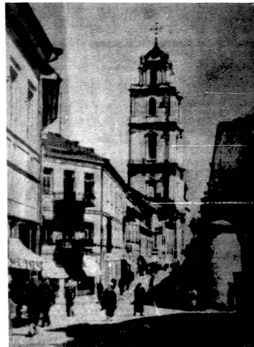
Dominikonų bažnyčia Vilniuje.

Į šį sąrašą neįeina aukos ($1382) surinktos praėjusią vasarą Pasaulio Lietuvių centre per Valdo Adamkaus pranešimą. ADAAL visiems aukotojams nuoširdžiai dėkoja ir taip pat maloniai prašo jų kilnų tikslą paremti ir ateityje. Aukos siųsti: American Dental Association for Assistance to Lithuania, 14911-127 St., Le-mont, IL, 60439. Tel. (708) 529-0955.