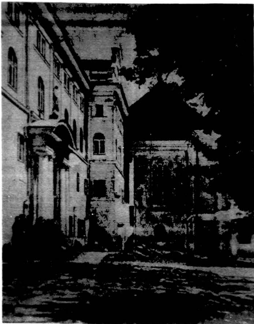
Kunigų seminarijos kiemo vaizdas Kaune.