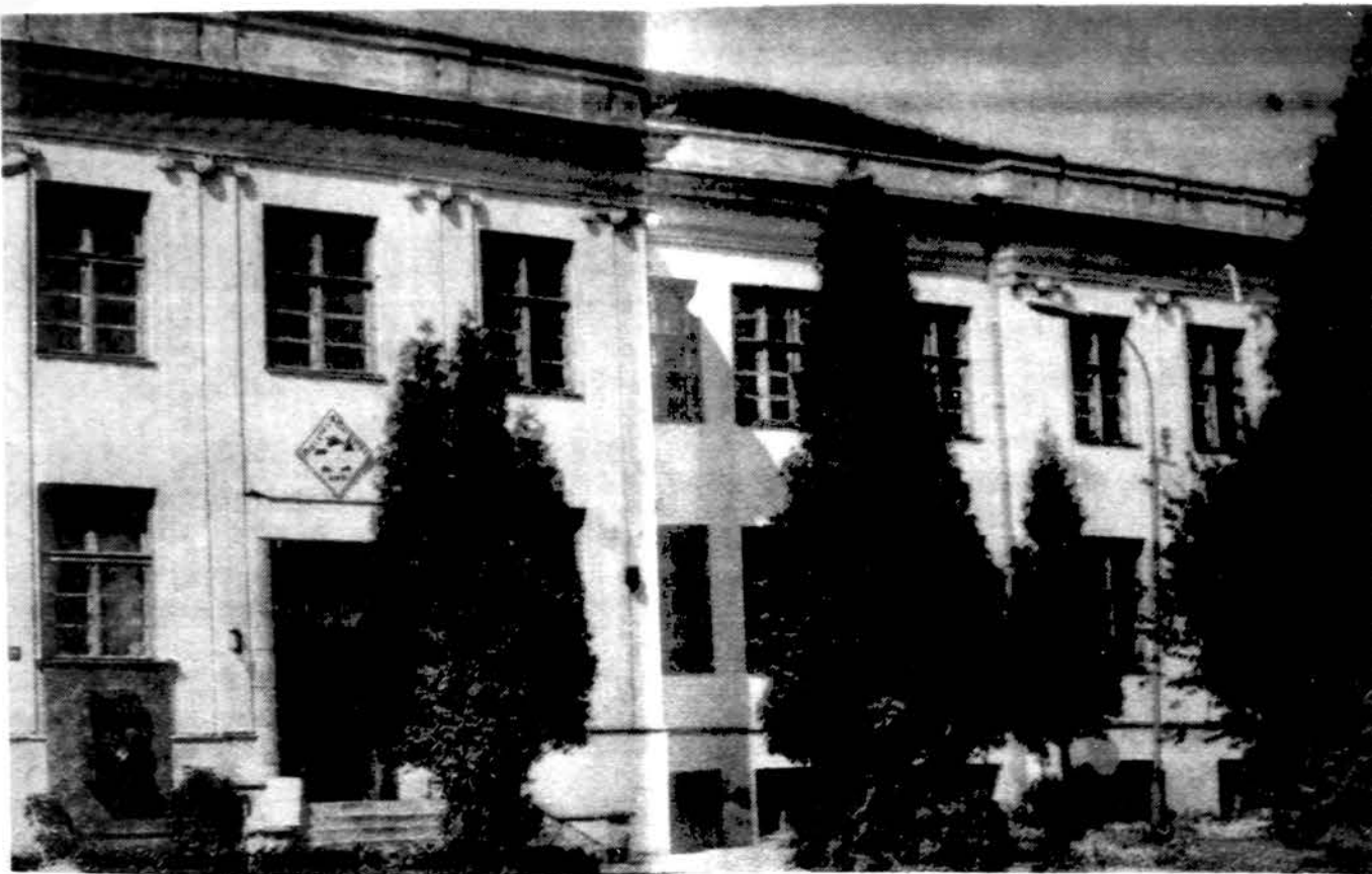
Panevėžio mergaičių gimnazija – dabar II vidurinė mokykla.

Dar to negana. Kai kurios mo- terys skundžiasi plaštakų atšalimu, kitos užėinančiais galvosūkiiais – abu negerumai gali nieko bendro neturėti su šilumos išpylimu. Mat, kiek- vienu metu, kai į smegenis