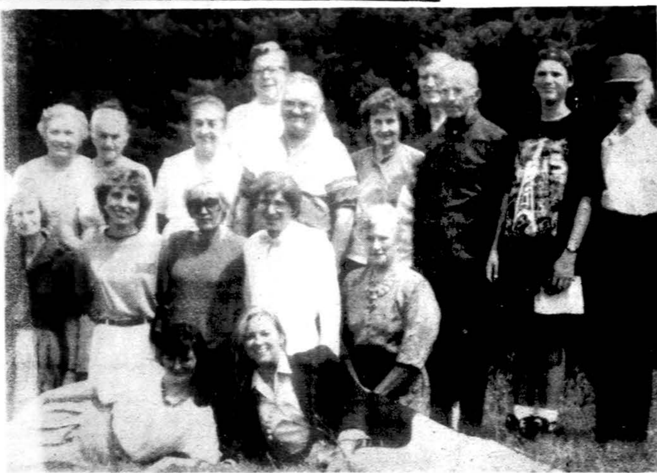
Lietuvių mokytojų studijų savaitės paskaitininkai ir pareigūnai Dainavoje rugpjūčio 2-9 dienomis.