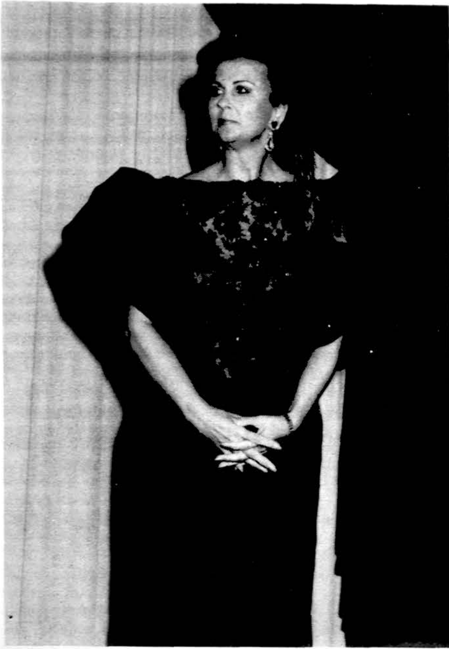
Sol. Birutė Vizgirdienė koncertuos St. Petersburg.