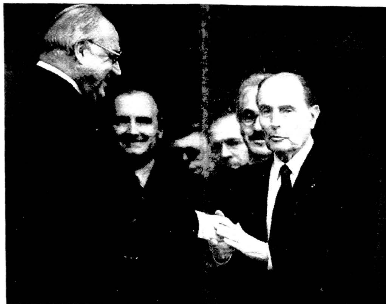
Vokietijos kancleris Helmut Kohl antradienį susitiko su Prancūzijos prezidentu François Mitterrand Paryžiuje pasitarti dėl Europos susijungimo ateities, po to, kai prancūzai taip silpnai teparėmė susijungimą. Kanc. Kohl prašė Mitterrand, kad jis nieko nedarytų, kas galėtų susilpninti Vokietijos markę.

Atsisaukime rašoma, kad Baltijos valstybių taryba aukštai vertina Lietuvos Respublikos ir Rusijos Federacijos pasirašytus dokumentus, bet atkreipia dėmesį į faktą, kad šie pasirašymai nėra tik pradžia ESBK Deklaracijos, priimtos 1992 m. liepos 10 d., 15-to straipsnio nurodymų įgyvendinimo. BVT