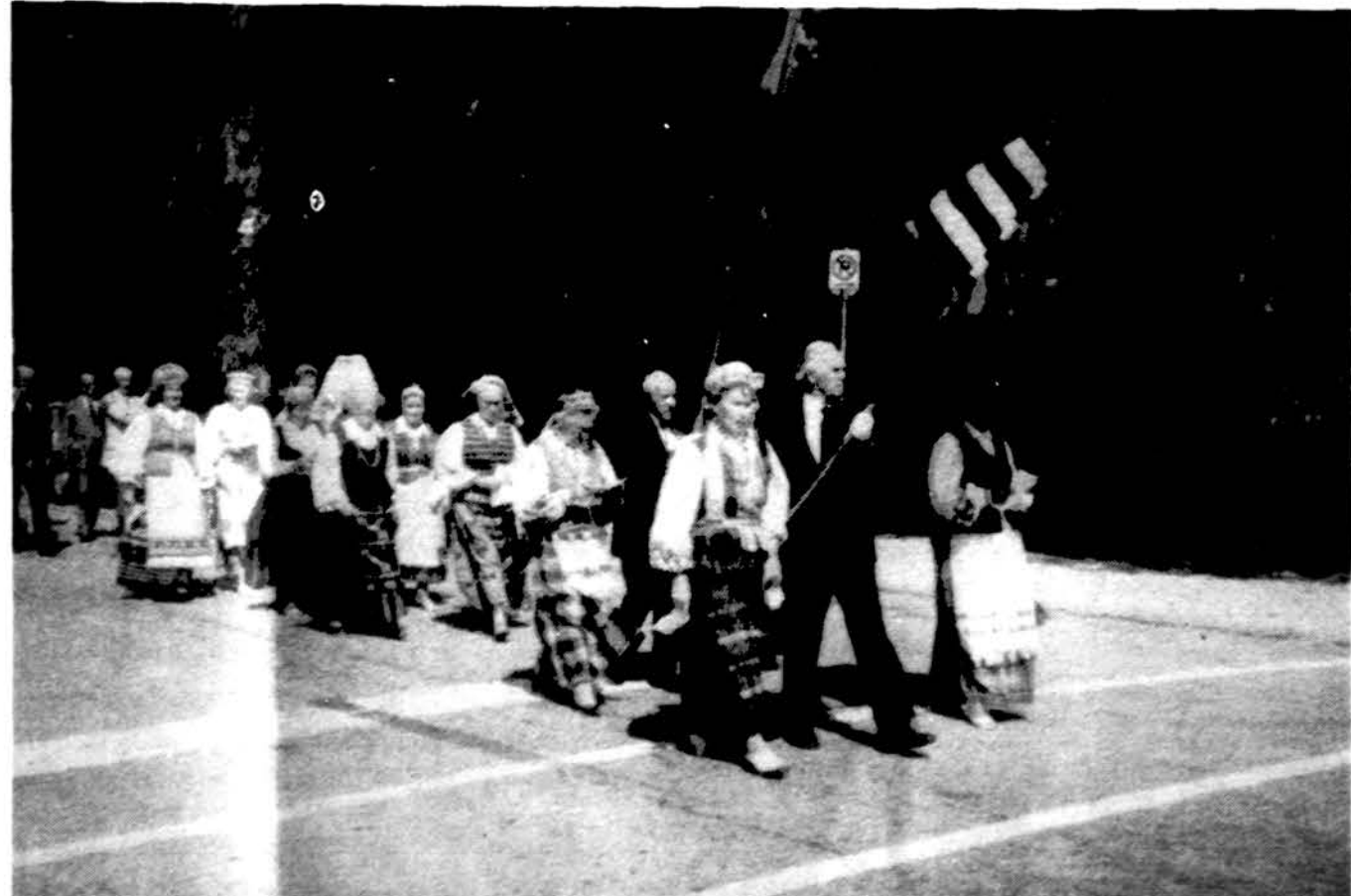
Švč. Mergelės Marijos Gimimo lietuvių parapijoj vykusių Šiluvos atleidų procesijos vaizdelis.