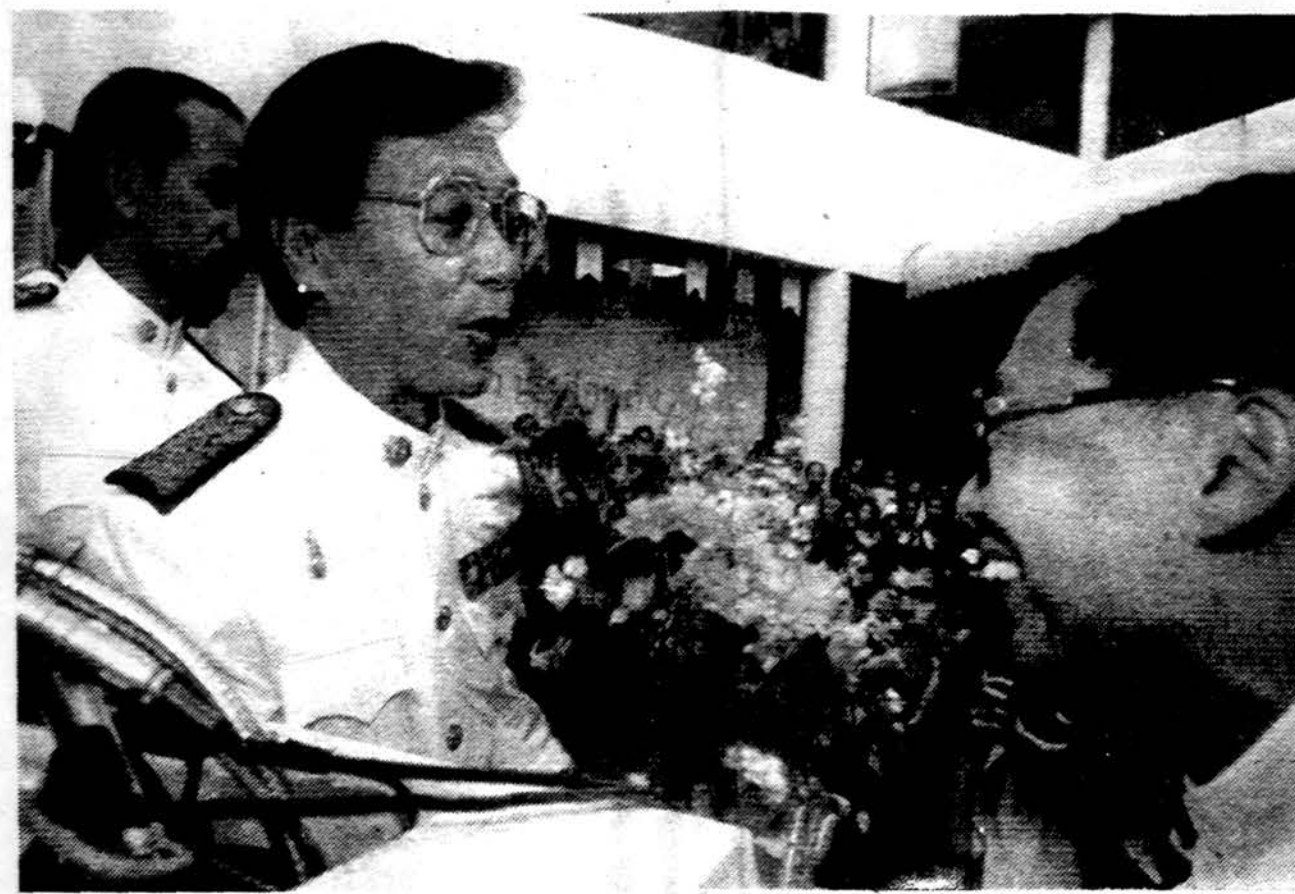
Bangkok, Tailandu ministru pirmininku buvo paskirtas Chuan Leekpai, po to, kai jam pavyko sudaryti vyriausybę. Jis pats buvo nuolatinis kovotojas prieš kariuomenės vaidmenį valdžioje, bet į jo koaliciją įeina viena didžiausių kariuomenės rėmėjų partijų.

Lietuvos Respublikos pasus jau turi 230,000 gyventojų (10%