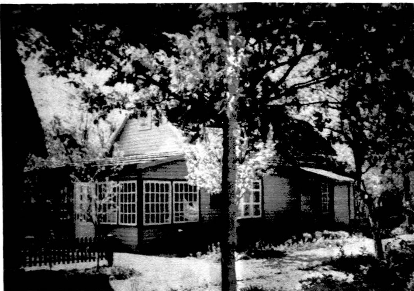
Čiurlionių nameliai Druskininkuose.

Daug negandų paveikslams teko išgyventi karo laikotarpiu. 1946 m. juos, nuo karo netektumų paslėptus Kauno Valst. Banko seife, užklupo Nemuno potvynis. Po karo, 1947 m. rugpjūčio 31 d. muziejų vėl atidarius lankytojams, Čiurlionio kūrinių su pertraukomis iš dalies eksponuojami, nežūrint kad laikas nuo laiko taryb. ideologai juos puldavo. Galutinai reabilituoti Čiurlionio kūryba, buvo įrengta pastovi ekspozicija ir pradėta galvoti apie spec. galerijos statybą. Toks specialus priestatas prie Kauno Valst. Čiurlionio Dailės muziejaus buvo baigtas statyti 1969 m., pagal architekto V. Vito projektą. Šis priestatas turi 300,8 kv. m ekspozicinio ploto, vėsinimo sistemą, specialų išsklaidytą matinį apšvietimą, kūrinių kabo atitraukti nuo sienos. Priestatas atidarytas lankytojams tu metų gruodžio 31 d. Jo pirmame aukšte, muzikos salėje, skamba muzikos kūrinių įrašai, rengiamos muzikinės po-