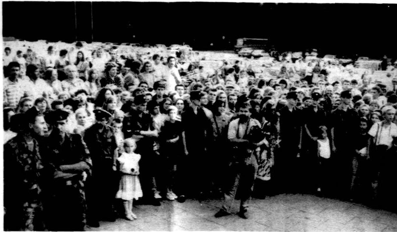
Vilniaus aerodrome minios žmonių laukė iš Barcelonos grįžtančių Lietuvos olimpiečių.