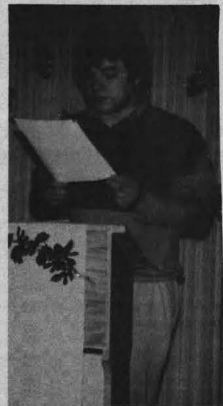
Poetas Julius Keleras skaito savo kūrybą „Ateities“ savaitgalio literatūros vakare.