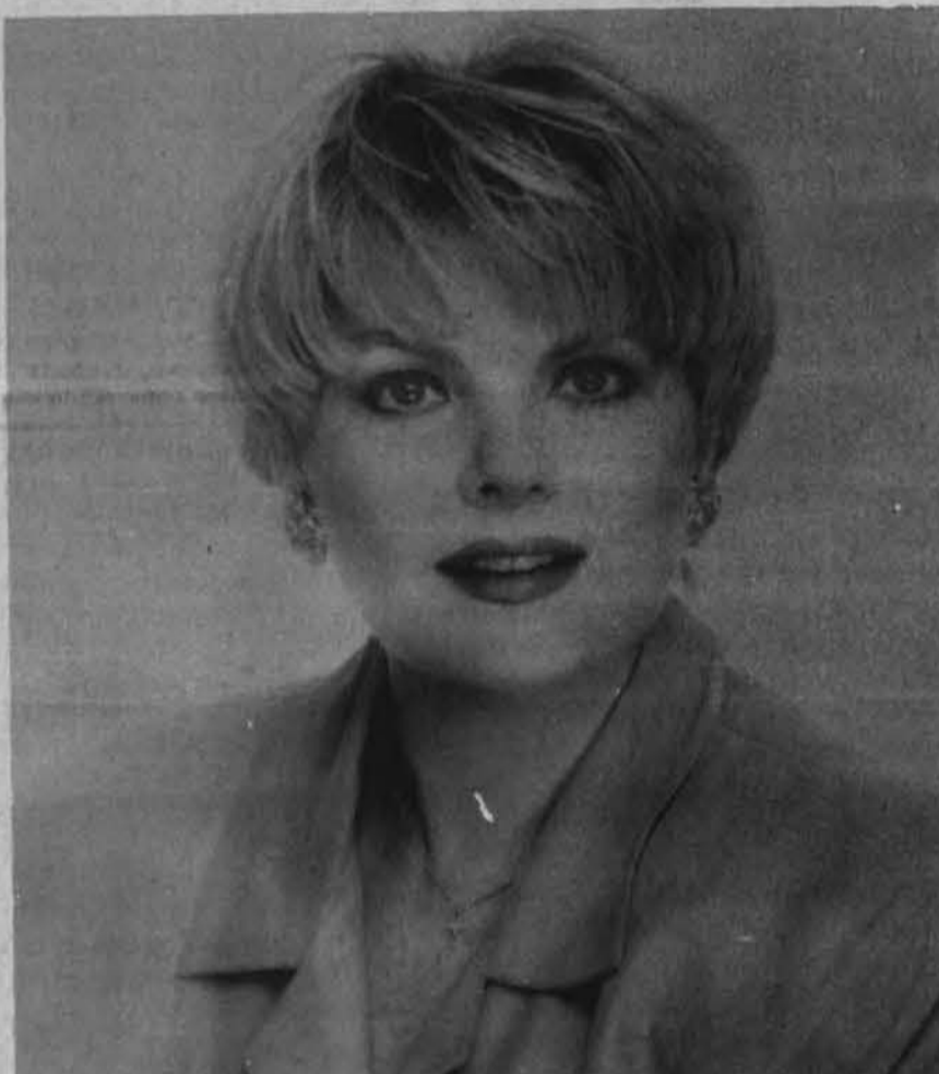
Jūratė Nausėdaitė-Ann Jillian koncertuos Drury Lane teatre, 100 Drury Lane, Oakbrook Terrace, IL, nuo spalio 7 d. iki 14 d. Jūratė, jei žino, kad salėje žiūrovų tarpe yra lietuvių, ne tik pasveikina lietuviškai, padainuoja lietuviškai, bet ir su dideliu malonumu bendrauja su jais po koncerto.

Išvadoje galima pasakyti, kad Amerika, reikalui esant, stengiasi visiems ekonomiškai pagelbėti. Bet ta pagalba greitai užmirštama. Kai susiduria interesai, tada nė vienas nenori daryti nors ir nežymių nuolaidų Amerikai, nes kiekvienam savi marškiniai yra arčiau kūno.