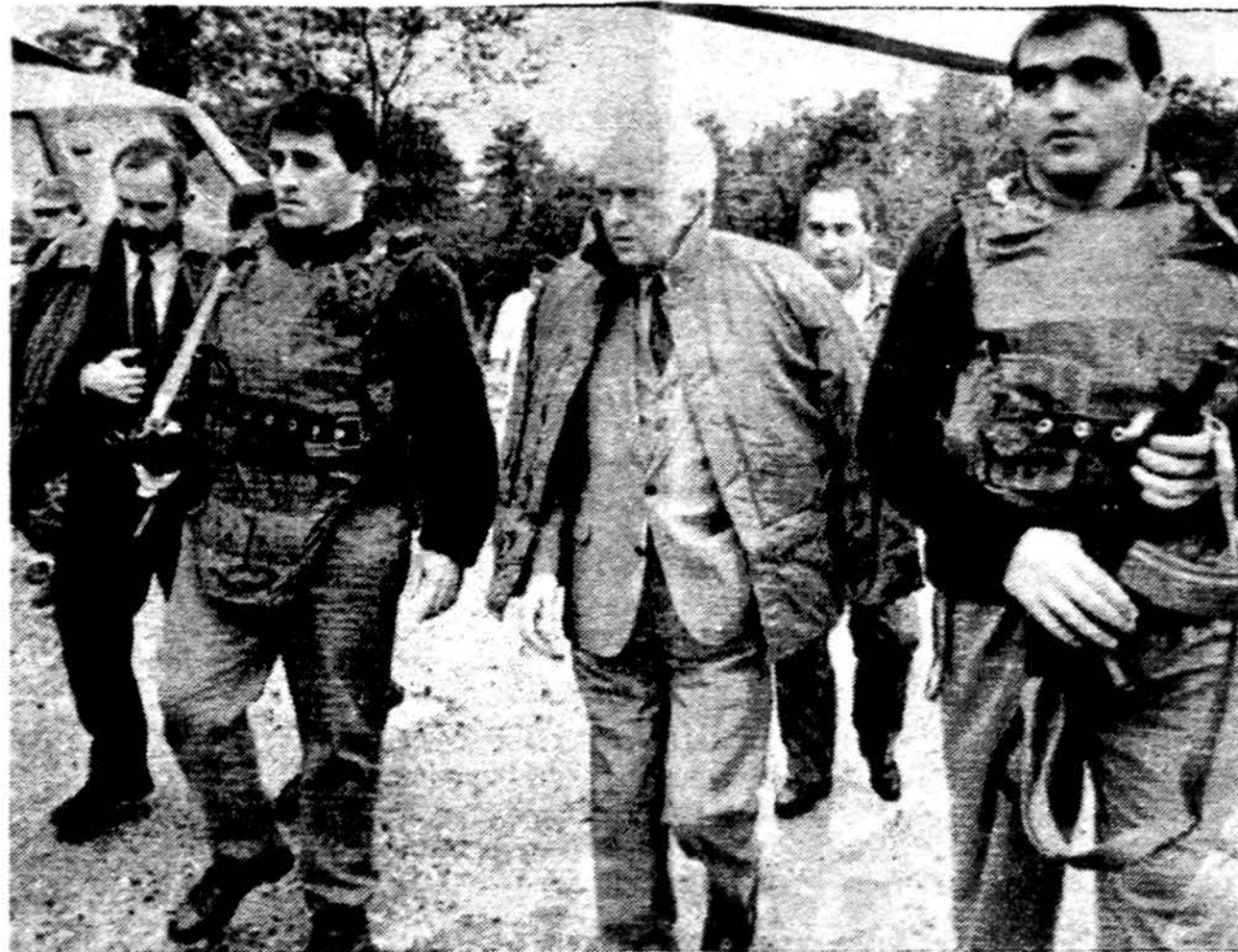
Gruzijos vyriausybės galva Eduard A. Shevardnadze lankosi Abkhazijos rajone, kur pirmadienį buvo numuštas gruzinų malūnsparnis. Gruzija jo nušovimu tuoj apkaltino rusus, bet Rusija kaltinimus atmetė, tvirtindama, kad malūnsparnį nušovė sukilėliai, kurie su gruziniais kovoja jau kelinta savaitę. Abkhazia nori atsiskirti nuo Gruzijos.