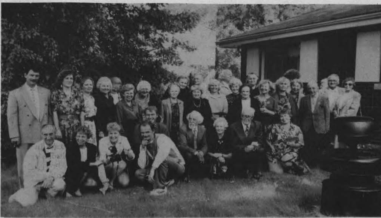
Lietuvių Tautodailės instituto metinio suvažiavimo, rugsėjo 19 d. vykusio Genanaque, Ont., Kanadoje dalyviai iš įvairių JAV ir Kanados vietovių. Jų tarpe ir trys tautodailininkai iš Lietuvos.