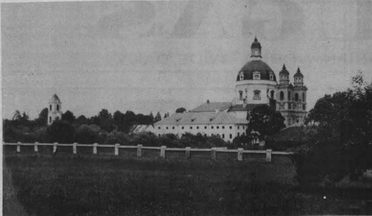
Gražusis Pažaislis, kuriame dabar apsigyveno Šv. Kazimiero seselės vienuolės.