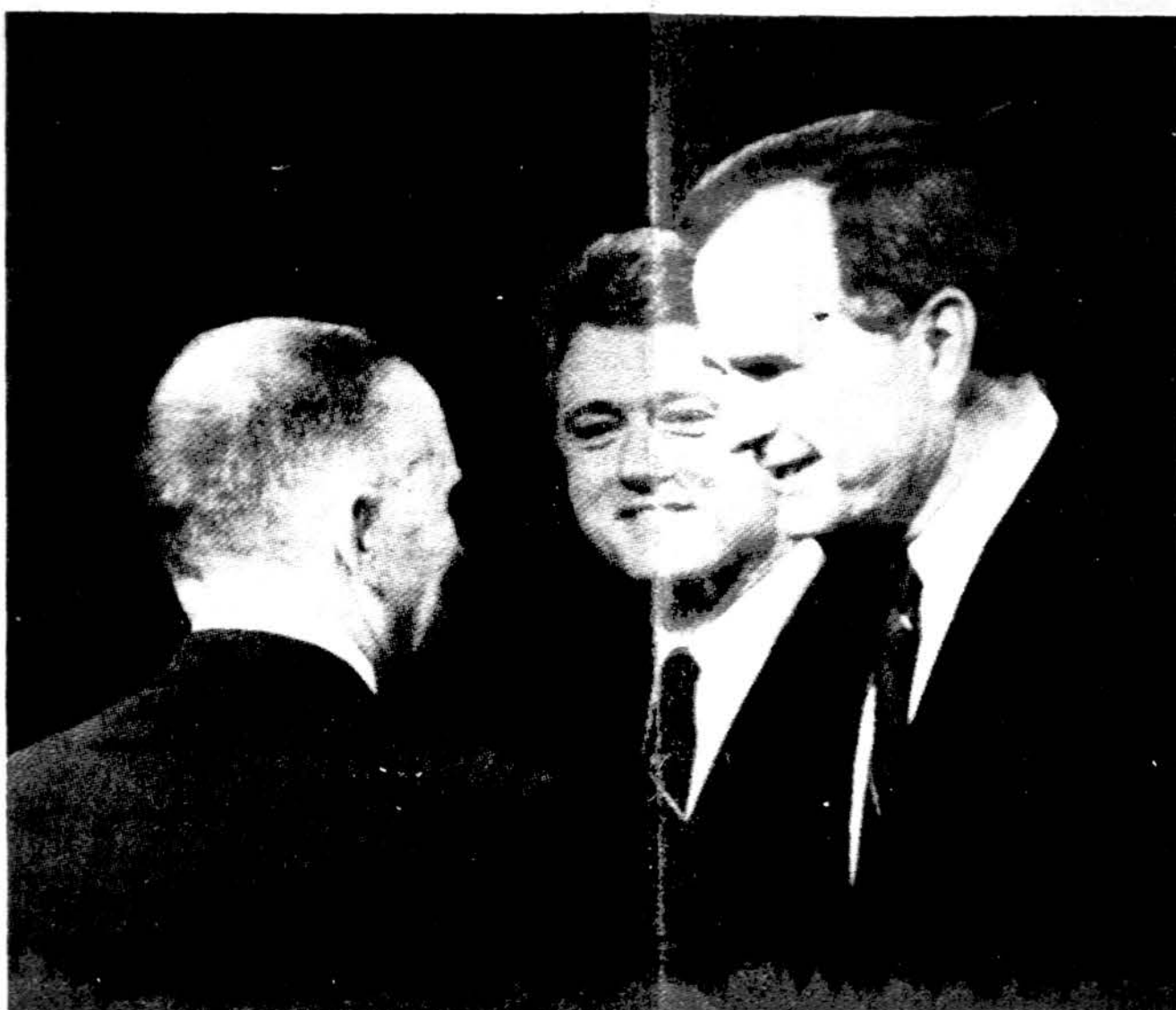
Prieš debatus sekmadienio vakarą sveikinasi trys jų prelegentai Ross Perot, gub. Bill Clinton ir prez. George Bush

Teologijos ir filosofijos sekcija posėdžiaus Kaune, Panevėžyje, Vilniuje. Sekcija „Gamta ir žmogus“ – Klaipėdoje. Pranešimus Sinoikijai paruošė filosofai ir dvasininkai iš Lietuvos, Italijos, Lenkijos, Didžiosios Britanijos, JAV, Švedijos. Bažnytinę muziką atliks bažnyčių ir pasaulietiniai muzikiniai kolektyvai. Iškilmingas Sinoikijos uždarymas – spalio 17 dieną, Vilniuje, Kompozitorių namuose. (J.V.)