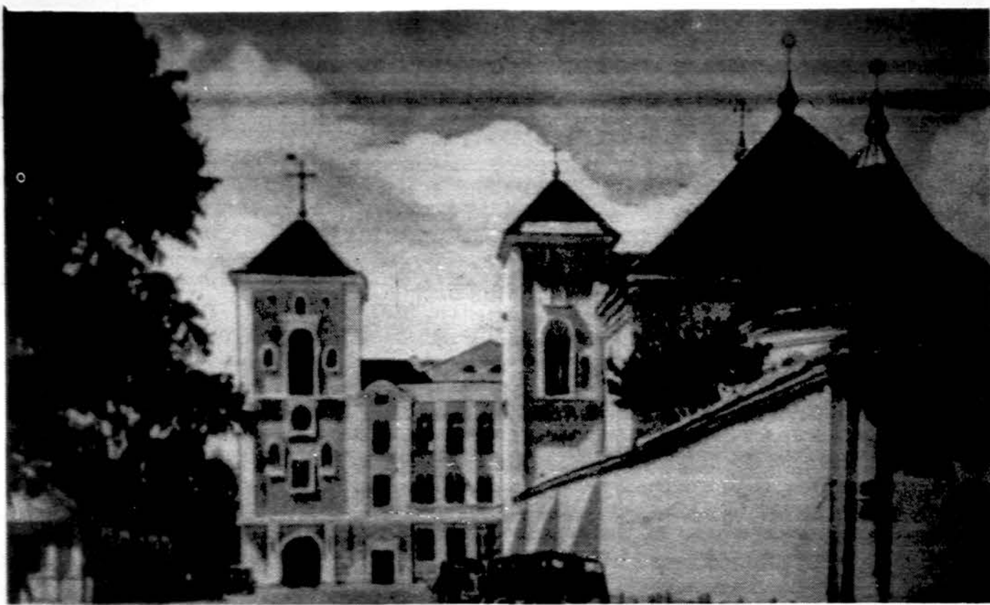
Kunigų seminarijos bokštai Kaune.