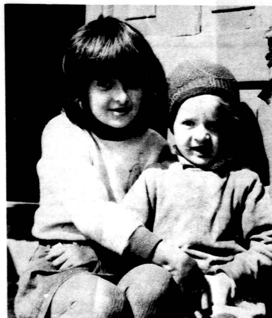
Smagu su broliuku, nors dienos ir rudena.