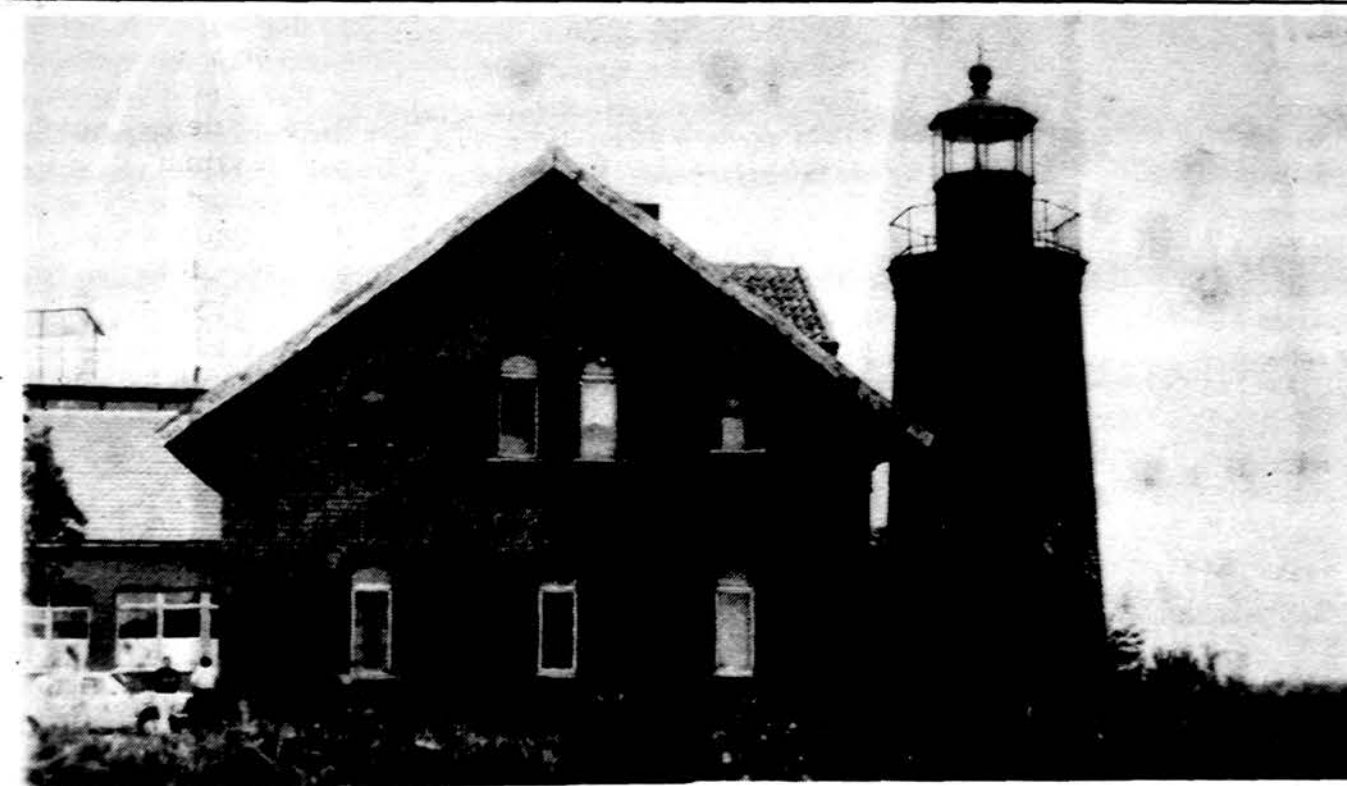
Ventės Rago švyturys ir paukščių žiedavimo stotis.