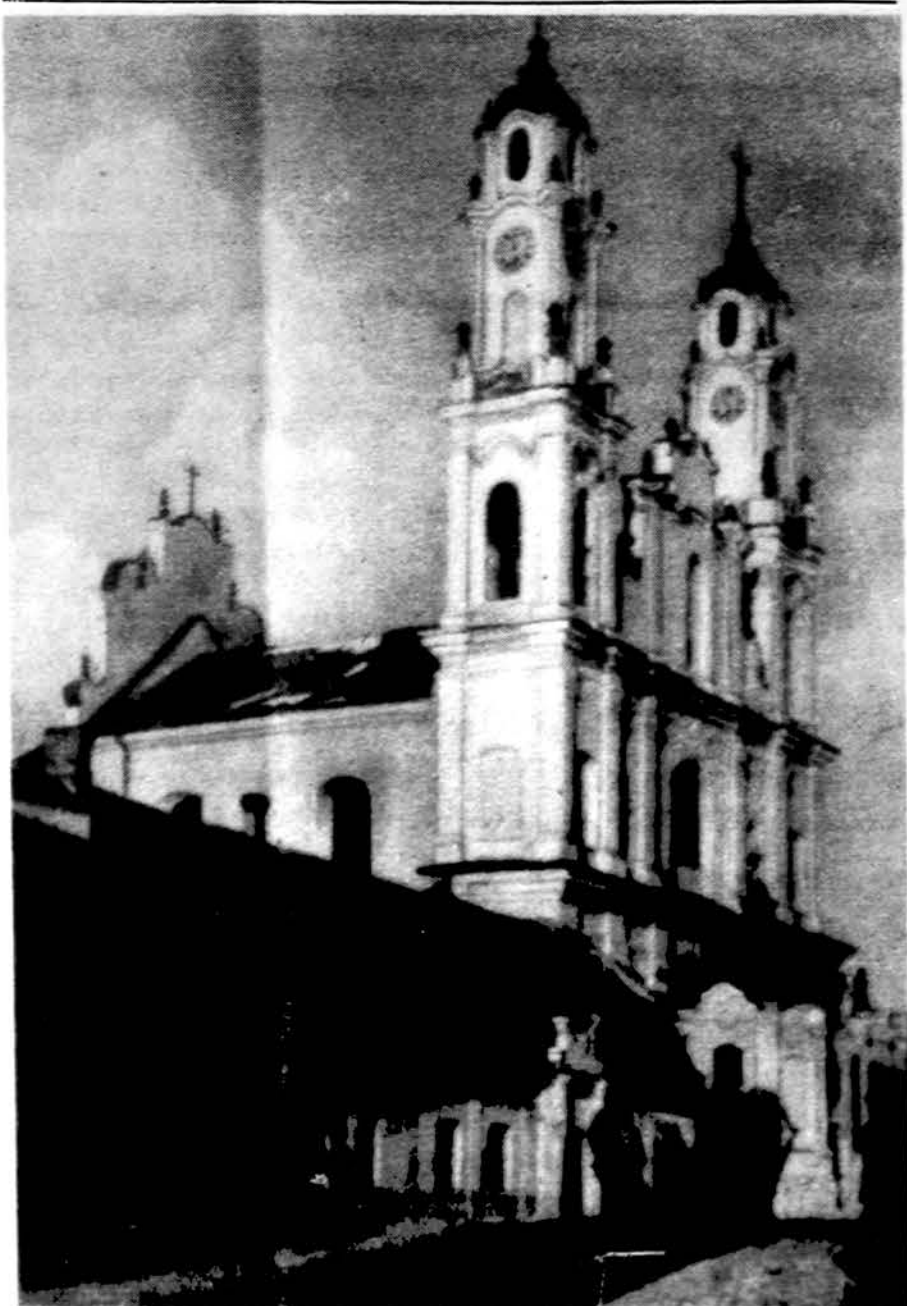
Misionierių bažnyčia Vilniuje – lietuviškojo baroko pavyzdys (XVIII a.).