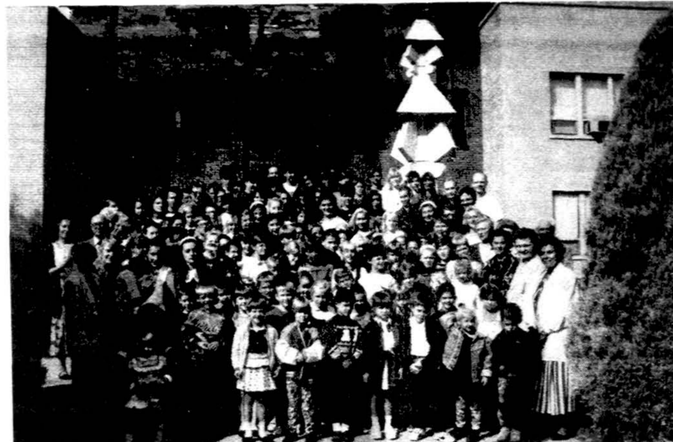
Naujoji jungtinė Chicago lietuaininė mokykla prie Jaunimo centro šių mokslo metų pradžioje.

x Nuo $675 iki $735 skrydžiai ten ir atgal iš Chicago į Vilnių! Bilietus reikia įsigyti iki spalio 31 d., o juos panaudoti – iki 1993 m. kovo 31 d. Kreiptis: American Travel Service, tel. 1-708-422-3000.