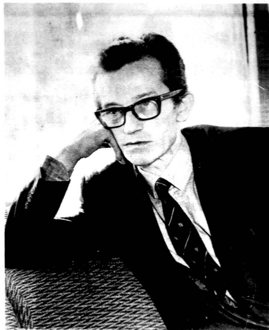
Juozas Tumelis, Lietuvos Sąjūdžio Tarybos pirmininkas.