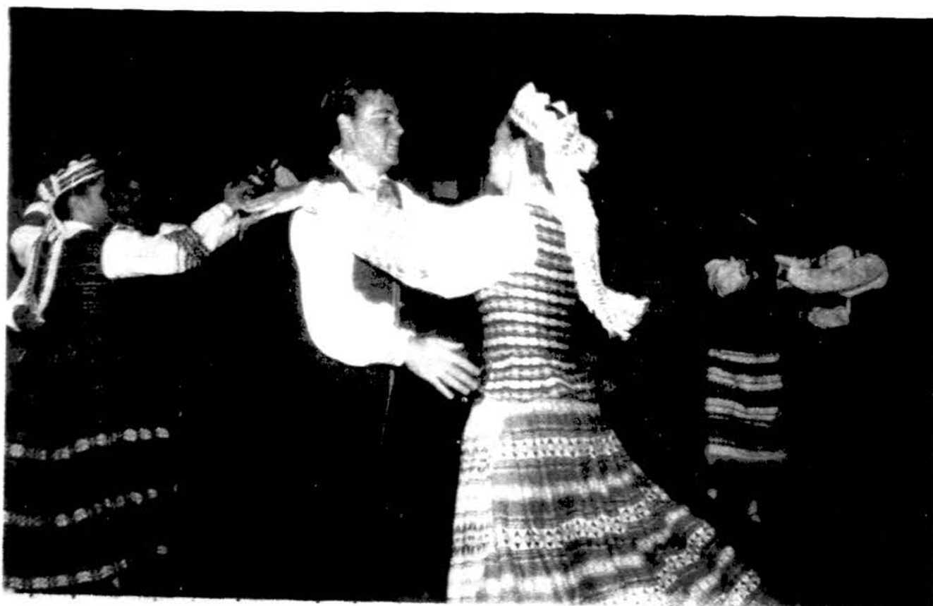
„Grandinėles“ šokėjai Clevelando Lietuvių dienų programoje.