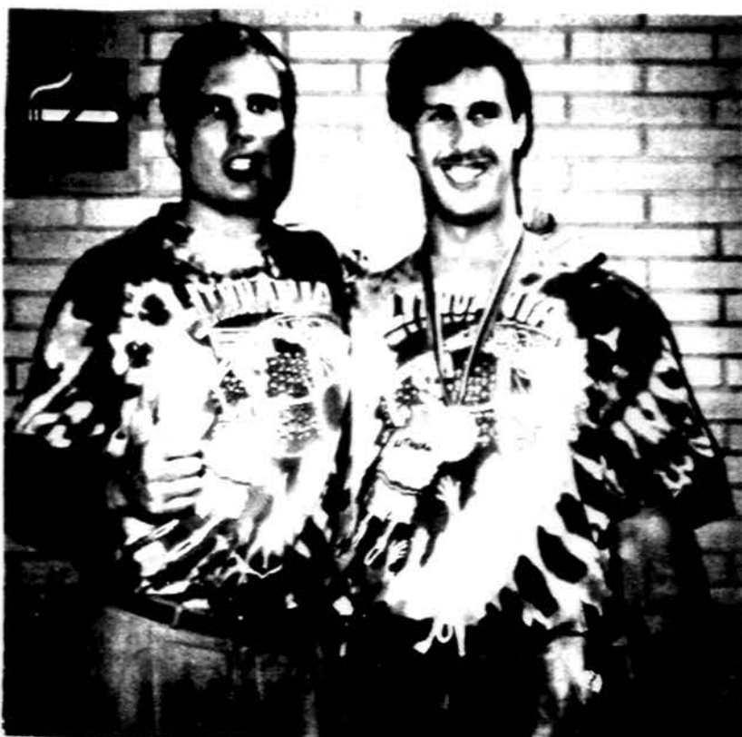
Šarūnas Marčiulionis ir San Francisco „Warriors“ trenerio padėjėjas Don Nelson modeliuoja marškinėlius, kuriais Lietuvos komanda vilkėjo Barcelonoje olimpiadoje. Šiuos populiarius marškinėlius parduosime jė telkia lėšas Lietuvos vaikų ligoninėms ir jaunimui.