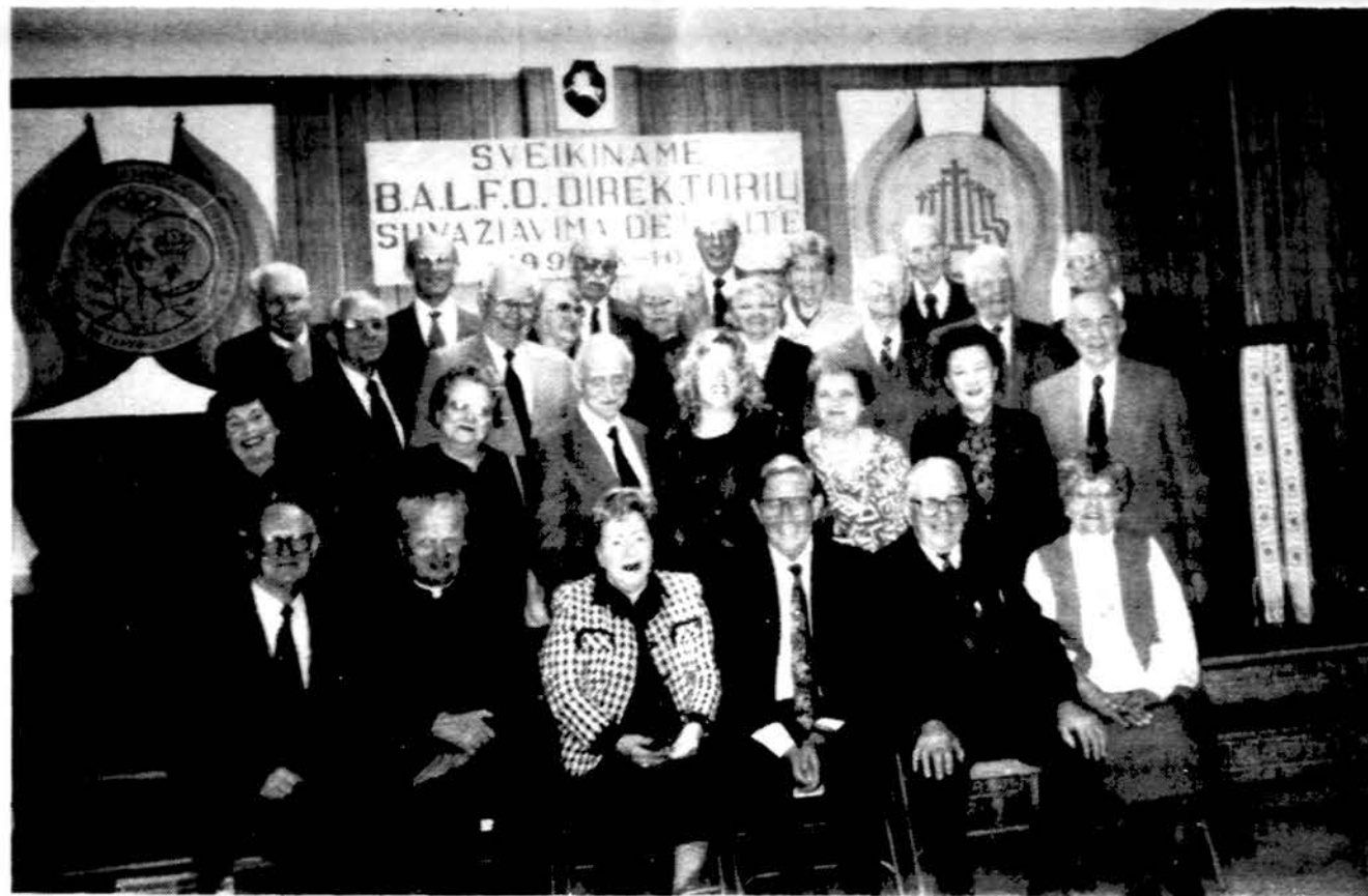
Balfio direktorių suvažiavimo dalyviai Detroite š.m. spalio 10 d.