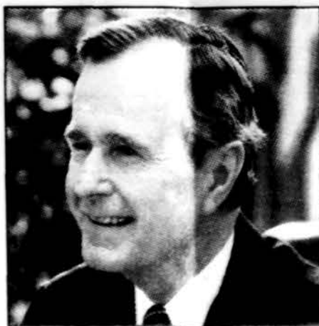
Paid for by Bush '92 General Committee, Inc.