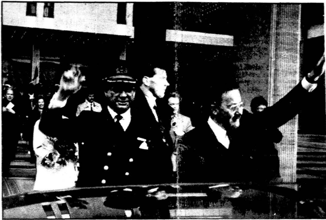
Svedijos karalius Carl XVI Gustaf (kairėje) ir Lietuvos AT pirm. Vytautas Landsbergis, jiems atvažiuavus prie Lietuvos parlamento rūmų spalio 16 dieną, kur Svedijos karaliui ir karalienei Silvijai buvo surengta iškilminga sutikimo ceremonija.

Dar kartą norime atkreipti informacijos agentūrų dėmesį į LDDP tarybos prezidiumo spalio 26 d. pareiškimą. Jame rašoma: „LDDP deputatai Lietuvos Respublikos Seime nuosekliai tęs nepriklausomą Lietuvos valstybingumą įtvirtinimo procesą, reikalauja neatidėliotino buvusios tarybinės armijos išvedimo ir nuostolių Lietuvai atlyginimo“. Pareiškime nedviprasmiškai pasisakoma už ūkio reformas ir kiek įmanoma išvėlinesnes jų pasekmes.