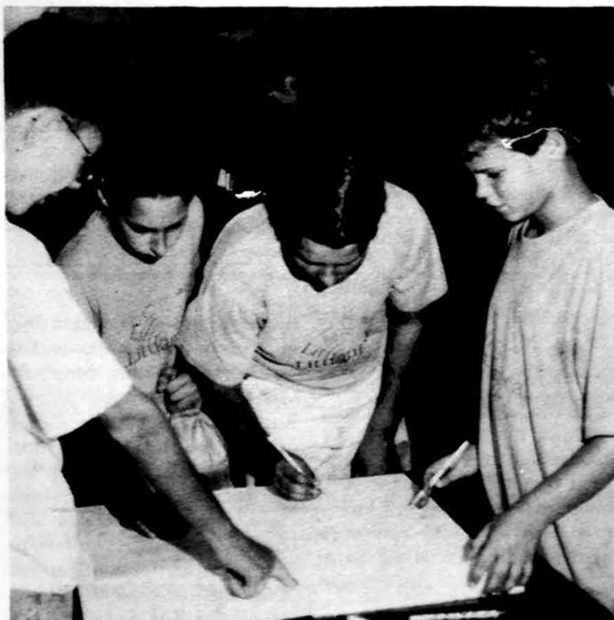
Maironio lituanistinės mokyklos mokiniai (Lemont, IL) pasirašo sveikinimą „Draugui“ jo vėjus metu.