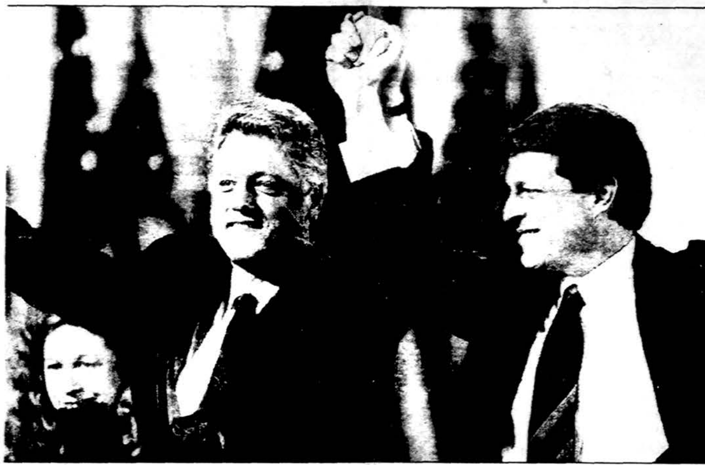
JAV prezidentinius rinkimus laimėjęs gub. Bill Clinton ir jo rinkiminis partneris sen. Al Gore antradienio vakare džiaugiasi, laimėję rinkimus.

Lietuvos geodezininkai dirba su įranga, kuri techniškai pasenusi 40-50 metų. Dėl to užtrunka žemės matavimo darbai, daug laiko sugaištama, kol sudaromi reikalingi žemėlapiai. Labai svarbi parama Lietuvos Valstybinei Geodezijos Tarnybai atėjo iš Šveicarijos. Jos vyriausybė skyrė lėšų mūsų šalies geodezijos ir kartografijos reikmėms finansuoti. Į Lietuvą atvykę Šveicarijos vyriausybės