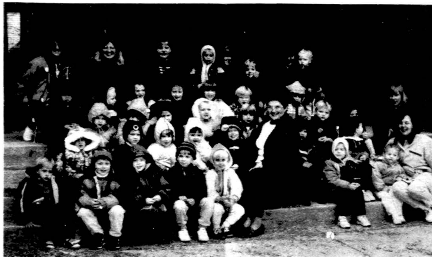
„Žiburelio“ auklėtiniai, mokytojos ir mamytės palydovės, pasirošusios tradicinei išvykai į moliūgų ūkį.

x ŽAIBAS ketvrti metai garantuoti ir patikimai ruošiasi užsienietiškas maisto prekes pristatyti Lietuvoje i namus laiku Kalėdų šventėms! Penkiolikos pakietų pasirinkimas! Kalėdiniai užsakymai priimami iki gruodžio 10-tos dienos. Kreiptis: „ŽAIBAS“, 9525 So. 79th Ave., Hickory Hills, IL 60457, tel. 708-430-9090. (sk)