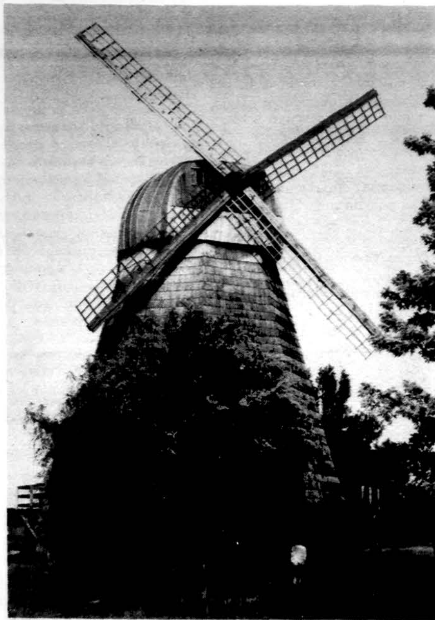
Linų muziejus prie Upytės.