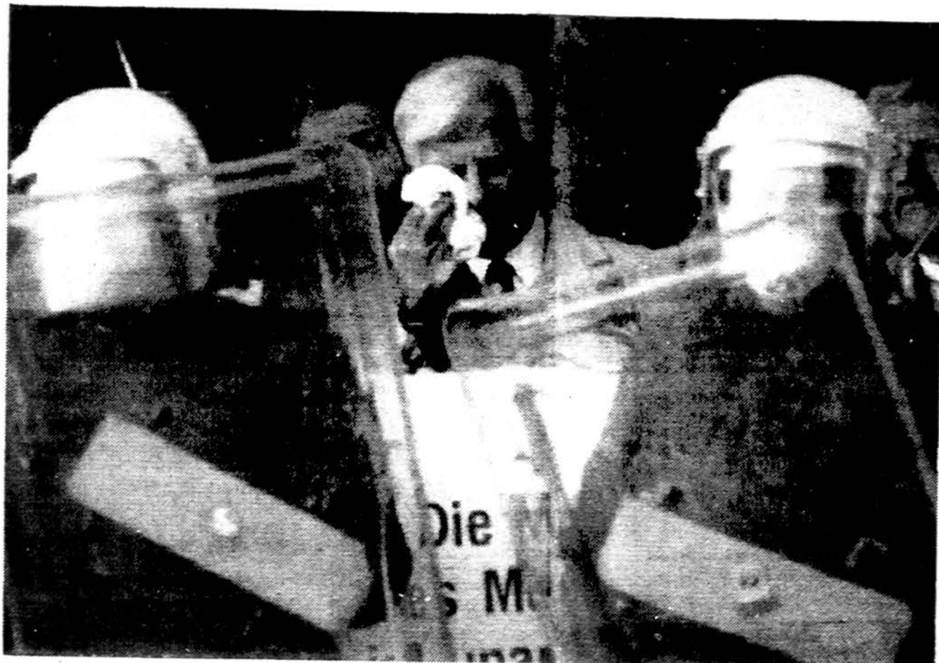
Vokietijos prez. Richard von Weizaecker buvo apmėtytas kiaušiniiais, eisenoje ir mitinge, susauktame Vokietijos valdžios vadų Berlyne protestuoti prieš smurtą išpuolius prieš užsieniečius.

Ekonomikos ministerijos kainų ir konkurencijos departamentas apskaičiavo Lietuvos gyventojų minimalaus pragyvenimo