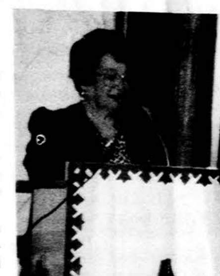
Vyresniųjų centre Chicagoje Seklyčio uolijoje trečiadienio popietė programų organizatorė kalba susirinkusiems svečiams.