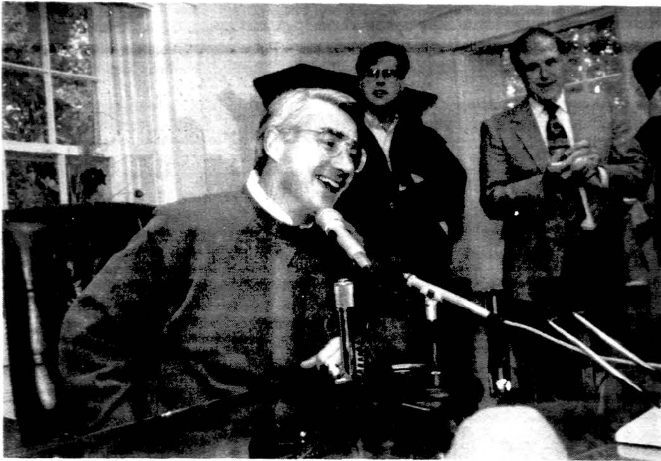
Illinois valstijos gubernatorius Jim Edgar, pasveikęs po arterijų praplėtimo operacijos, jau pradėjo kasdieninį darbą.

Prostata yra vyriškų lytinių organų liauka, kaštono dydžio, esanti šiek tiek žemiau šlapimo vėžio ir laiku pradėti gydymą. Pradžioje vėžys nesukelia jokių skausmų ir simptomų, todėl jį ir sunku diagnozuoti. Todėl vyresnio amžiaus žmonėms būtina pastoviai profilaktiškai tikrintis pas gydytoją, nors ir gerai jaučiantis. Žinoma,