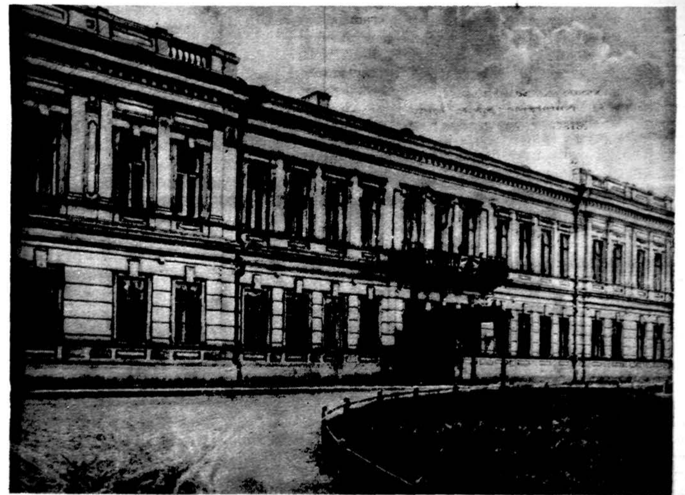
Krašto Apsaugos ministerijos rūmai Kaune maždaug 1935 m.