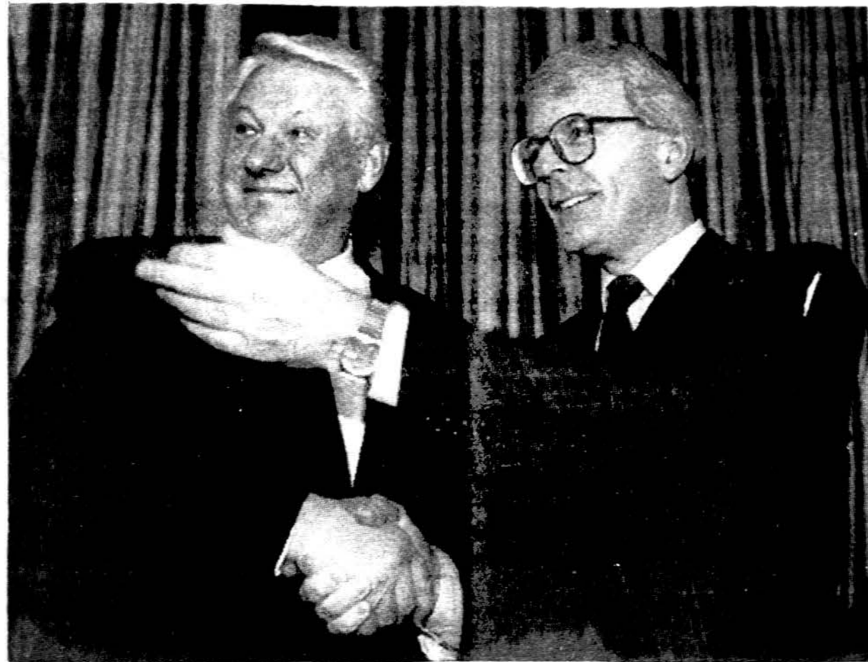
Pirmą kartą Anglijos valstybėje susitiko prez. Boris Jelcinas (kairėje) ir britų ministras pirmininkas John Major. Jiedu pirmadienį pasirašė pirmąją nuo 1766 metų draugiškumo sutartį tarp Rusijos ir Anglijos.

Vilniaus darbo birža per spalio mėnesį į savo sąrašus įtraukė 1143 bedarbius, iš jų 628 moteris. Pašalpomis per spalį išmokėta 4,338,771 talonų. Darbo birža įdarbino 291 bedarbį - 118 darbininkų, 173 tarnautojus. Laisvų darbo vietų užregistruota 1033, daugiausia darbininkams - 903. Tarp bedarbių daugiausia ekonomistų su aukštuoju išsilavinimu, pedagogų, inžinierių, gamtos ir humanitarinių mokslų specialistų. Sunkiau susirasti darbo darbininkams, turintiems šaltkalvio, vairuotojo, staklininko profesiją. Didžiausias yra statybininkų poreikis: mūrinių, betonuotojų ir kitų.