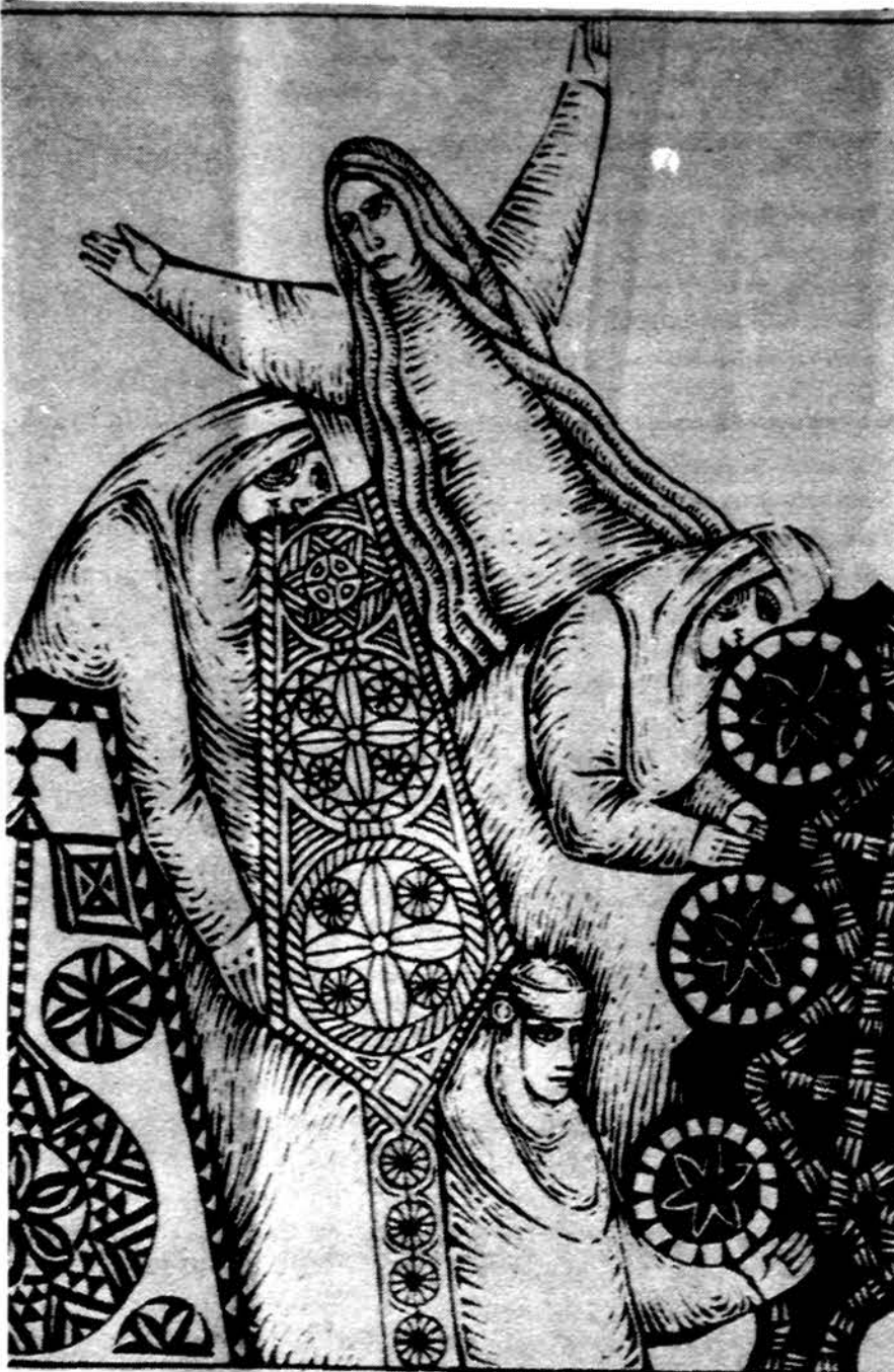
Seniau Lietuvoje ilgais rudens ir žiemos vakarais mergaitės dainuodamos, pasakas pasakodamos, verpdavo ir ausdavo. (Iš „Šeimos kalendoriaus“)

Isteigtas Lietuvių Mokytojų Sąjungos Chicago skyriaus