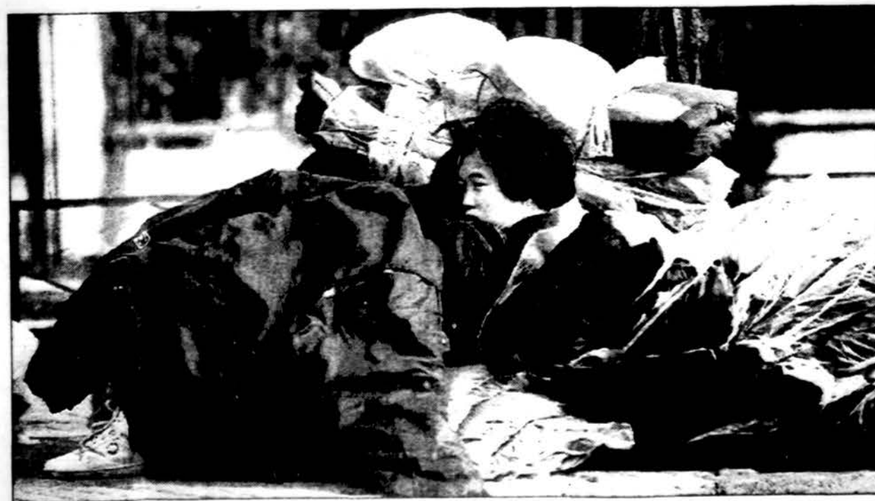
Beidzinge. Kinijoje, atėjus žvarbiam orui iš Sibiro, mergina drabužių parduotuvėje turguje rado užuovėją už žieminių apsiustų.

Ketvirtadienį debesuota, ryte galimybė lietus. Saulė leidžiasi 4:33. Temperatūra dieną 45 F (7 C), naktį 35 F (2 C). Penktadienį saulė teka 6:36, bus debesuota, vėjauta, žymiai šalčiau, gali snigti. Temperatūra dieną 35 F (2 C), naktį 20 F (-6 C).