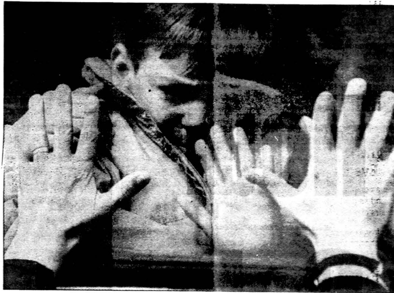
Vaikas su motina, antradienį išvykstantys iš Sarajevo, atsiveikina su mieste liekančiu tėvu. Buvo leista išvykti motinoms, vaikams ir seneliams, bet ne vyrams tarp 18 ir 60 metų.