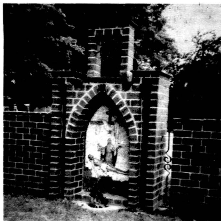
Kryžiaus keliu stotis Kernavės bažnyčia supančioje mūrinėje tvorėje.