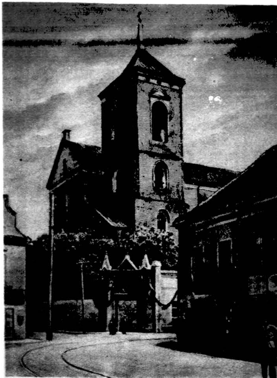
Zemačių vyskupų katedra Kaune prieš II pasaulinį karą.