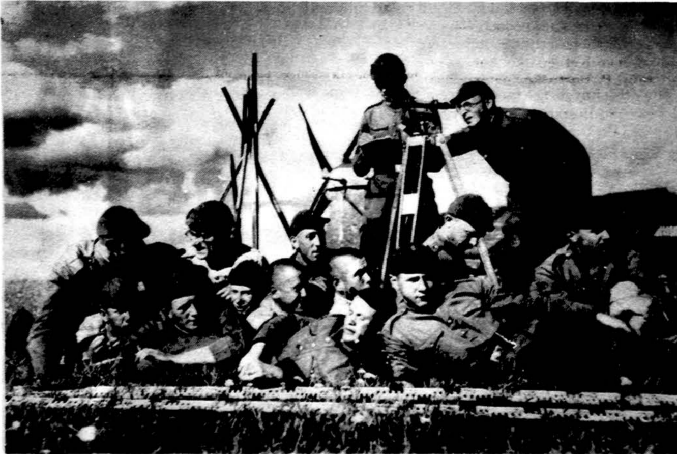
Geodezijos lauko pratimuose pertrauka. 1937 m. Radviliškis, 2. inžinierijos batalione karūnai aspirantai.

Lietuvoje yra 45 miškų urėdijos. Viena didžiausių dabartinių problemų, ypač Panevežio, Biržų, Ukmergės, Kėdainių, Marijampolės, Joniškio ir Rokiškio urėdijose, yra jaunų medelių bei želdinių sunaikinimas, kurį atlieka starnos, briedžiai ir elniai. Lapkričio pradžioje Lietuvos miškininkų sąjunga Panevežio urėdijoje surengė pasitarimą, koku reikėtų imtis priemonių žvėrių daromai žalai miškuose sumažinti. Miškininkai nutarė, kad turi būti kaip galima greičiau parengta valstybinė želdinių apsaugojimo ir žvėrių skaičiaus reguliavimo programa.