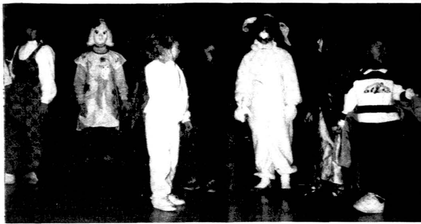
Chicago liuanistinės mokyklos darželio mokiniai, pasipuosę margais kostiumais Kaukių dienos šventėje Jaunimo centre.

x NAMAMS PIRKTI PASKOLOS duodamos mažais mėnesiniais įmokėjimais ir prieinamais nuomociniais. Kreipkitės į Mutual Federal Savings, 2212 West Cermak Road – Tel. (312) 847-7747.