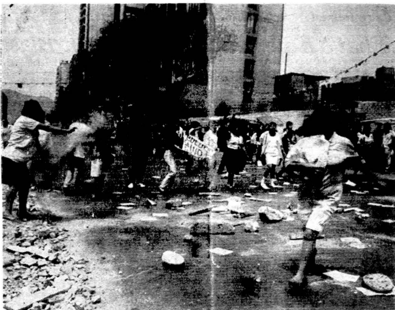
Peru sostinėje Limoje artėjant parlamento rinkimams, žmonės bėga nuo ateinančio sekmadienio parlamento rinkimų protestuojančių demonstrantų. Maoistų „Švintiniojo tako“ sukilėliai paskutiniu metu susprogdino daug bombų, padarydami žalos bankams, gazolino stotims ir policijos stotiai. Jie grasino užmušti žmones, keliaujančius į darbą trečiadienį ar ketvirtadienį.