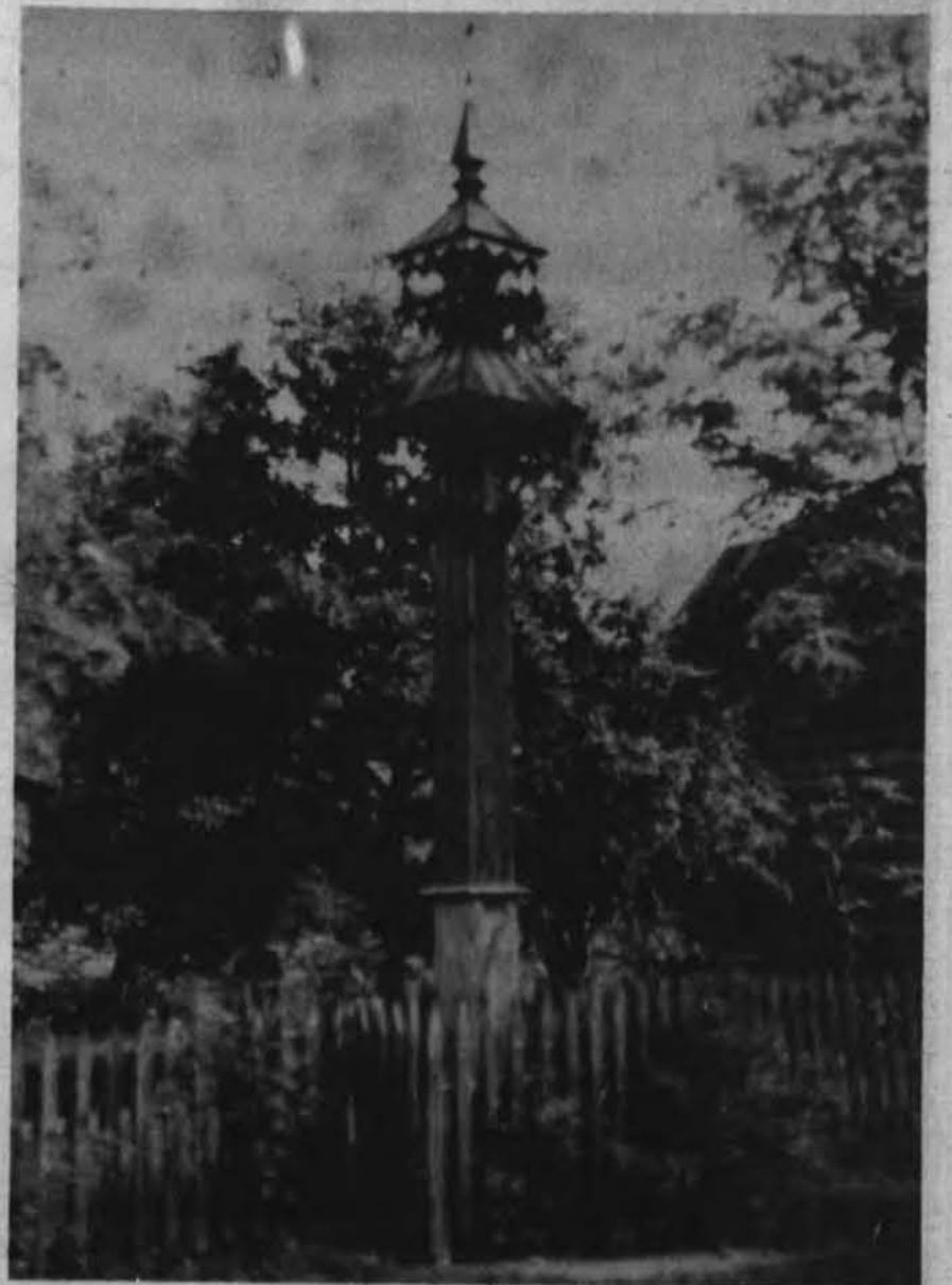
Lietuvos sodybos vėl gali laisvai puošti kryžiais.

„Lietuvių Tautos apsisprendimu 1918 m. vasario 16 d. atstatyti nepriklausoma Lietuvos valstybė, įvertinusi save 1920 m. gegužės 15 d. Steigiamojo Seimo rezoliucija ir 1922 m. Lietuvos Valstybės Konstitucija, tapo pasaulio tautų