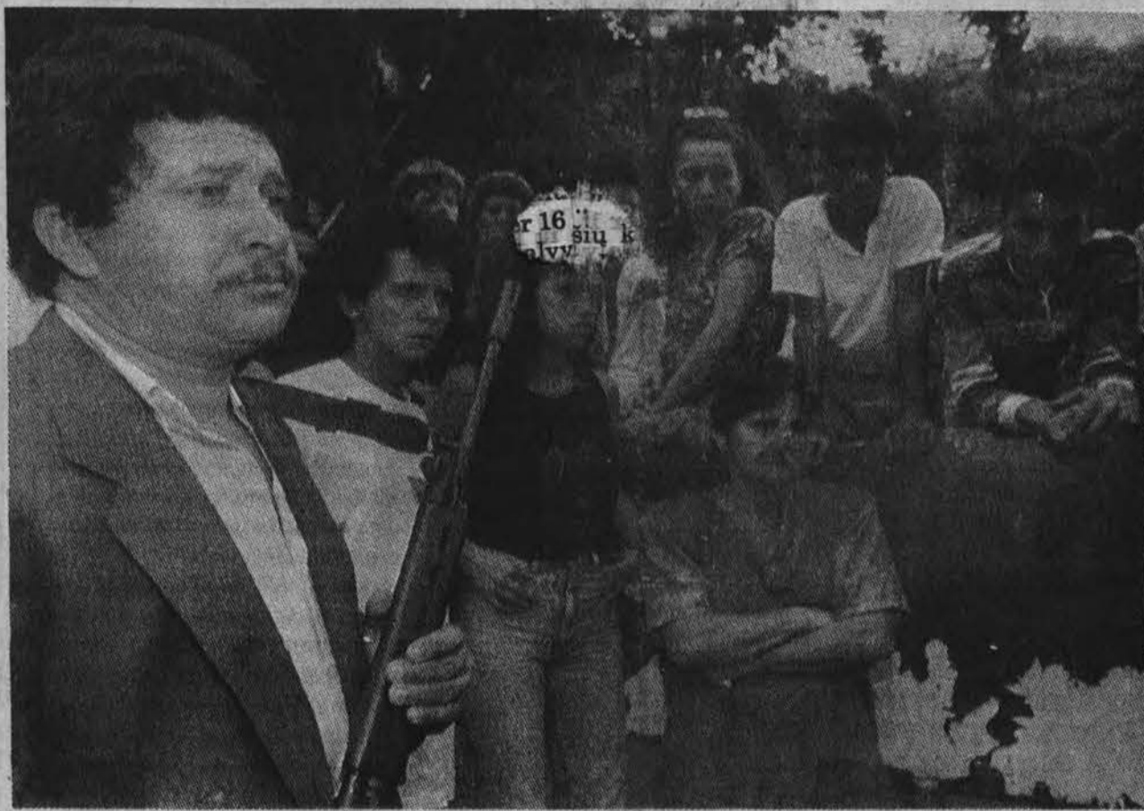
Venezueloje civiliai apsirengę policininkas saugo perversmo bandymo metu žuvusiųjų gimines, laukiančius eilės atpažinti savuosius. Tai buvo jau antrasis bandymas nuversti nepopuliarų prezidentą Carlos Andres Perez, kuris ir po šio bandymo tvirtino neatsistatydinsiąs ir savo vietą užleisiantis tik ateinančiais metais teisėtai išrinktam savo įpėdiniui. Perversmo metu žuvo 230 asmenų.