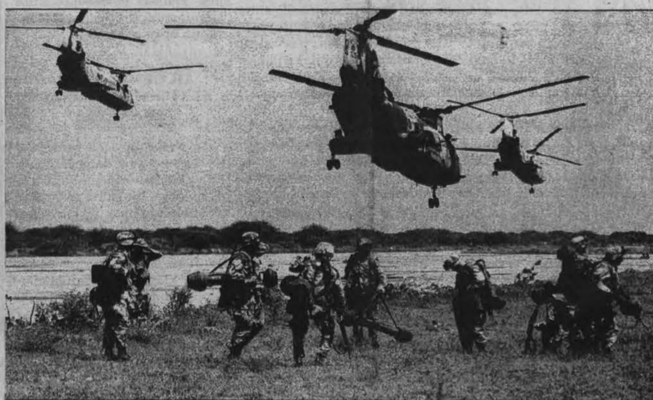
JAV sraigtasparniai saugo marinius užimančius Bale Dogle aerouostą Somalijoje. Iš jo JAV karinės pajėgos skristysis po įvairias Somalijos vietas, pirmiausiai į Baidoa.