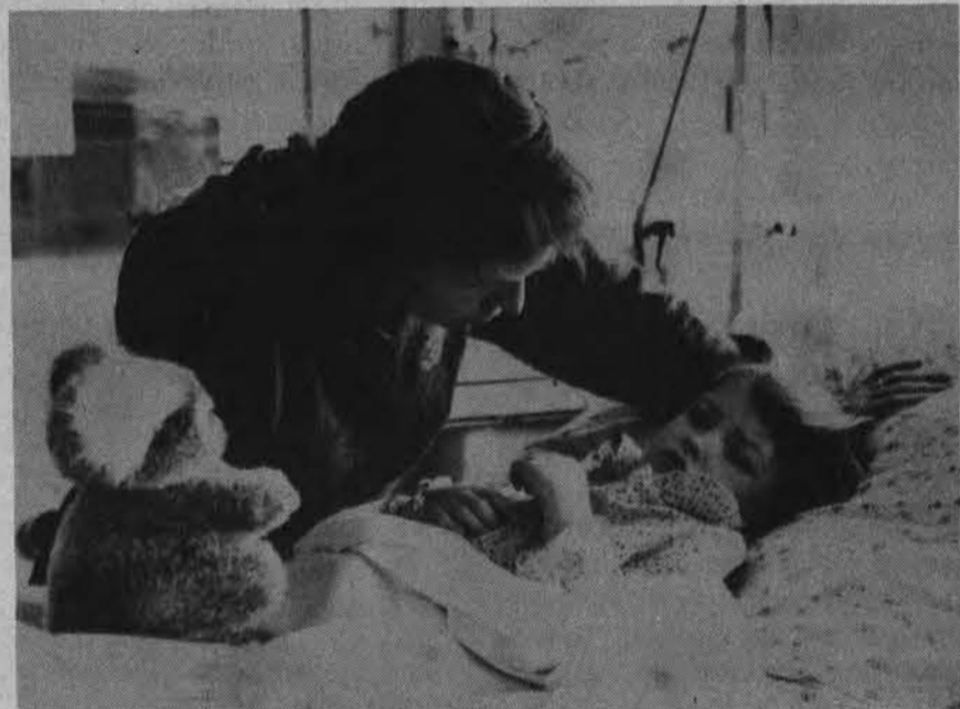
Vilniaus universiteto ligoninėje motina su neseniai operuotu savo vaikučiu. Operaciją atliko Deborah projekto gyd. Lynn Mc Grata.

Šiame sąraše suminėta tik nedidelė dalis pasaulio persekiojamųjų ir vargstančių. Jų yra daug daugiau visuose žemynuose, kone visuose kraštuose. Tai didžioji šiuolaikinė mūsų planetos tragedija.