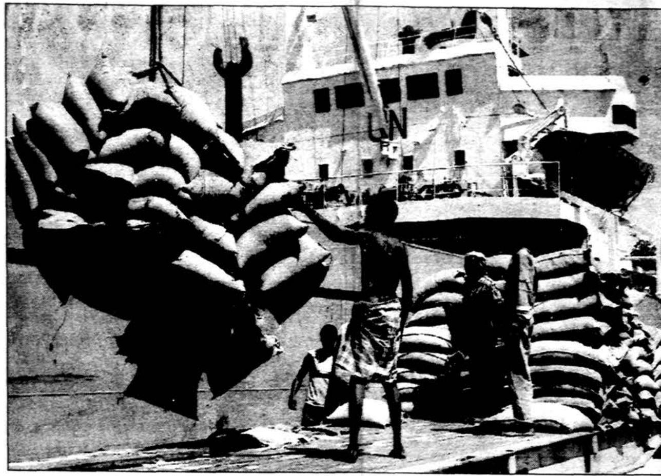
Somalijoje maistas iškraunamas iš Danijos laivo Mogadishu uoste. Trečiadienį, pirmą dieną po atvykimo į Baidoa, JAV ir Prancūzijos kariai rūpinosi užtikrinti saugumą mieste, kad badaujančiuosius pasiektų šalpos įstaigų siunčiamas maistas.

Kaune surengta tarptautinė konferencija „Sveikų miestų