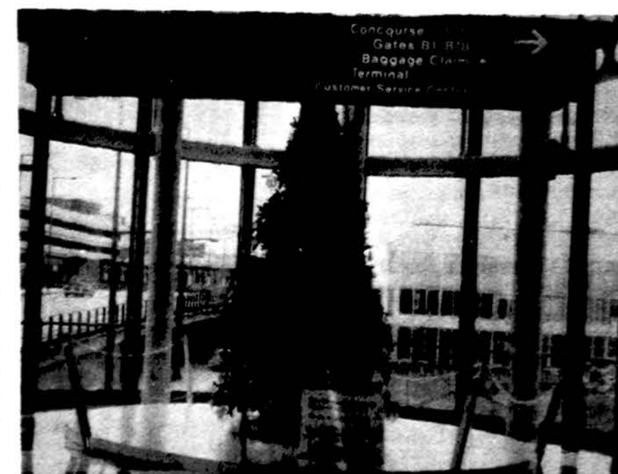
Lietuviška eglutė Chicagos O'Hare aerodrome.