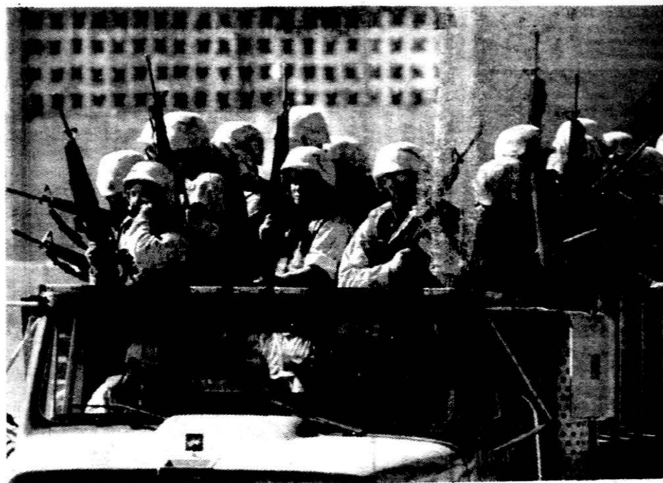
Sunkvežimis su JAV kariais važiuoja Mogadishu mieste. JAV pareigūnai sekma dienį pranešė, kad griežčiau veiks nuginkluoti somaličius.

Wiesenthalio centras yra pirmą kartą prašęs Lietuvos valdžios paduoti reabilituotojų sąrašą, kad jis galėtų palyginti