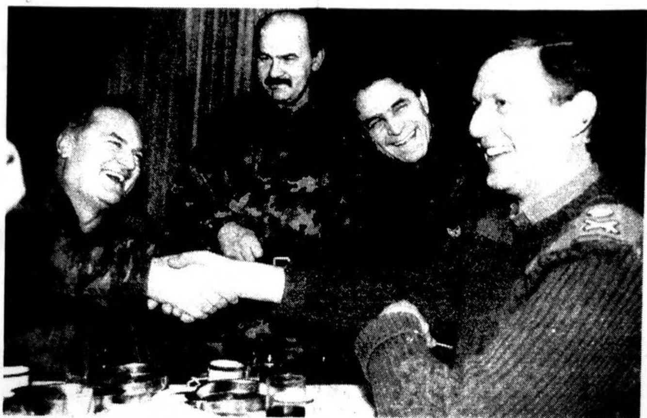
Sausio 1 d. Sarajevo aerodrome susitiko Bosnijoje esančių kariuomenių vadai tartis apie keturių mėnesių pailaubas. Bosnijos serbų karių vadas gen. Ratko Mladič (kairėje) sveikino vyriausią Jungtinių Tautų pajėgų vadą leit. gen. Sir Michael Rose, pasirašius laikiną pailaubų sutartį. Su tuo pasirašymu prasideda serija būsimų tokių susitikimų, kuriuose bus ieškoma visoms pusėms priimtinos taikos sutarties.

Kalbėdamas apie Konstitucinio Teismo sprendimą, kuriame konstatuota, kad Aukščiausiojo