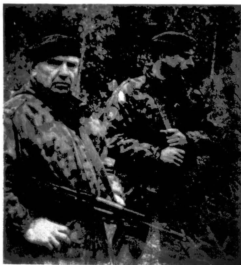
Dvieju kartų savanoriai dabartinėje tėvynės apsaugos tarnyboje.