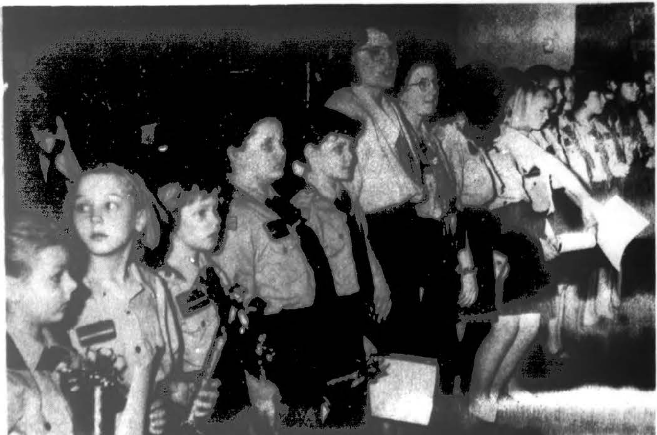
„Aušros Vartų/Kernavės“ skautių tuntu sesės rikiuojasi iškilmingai sueigai.