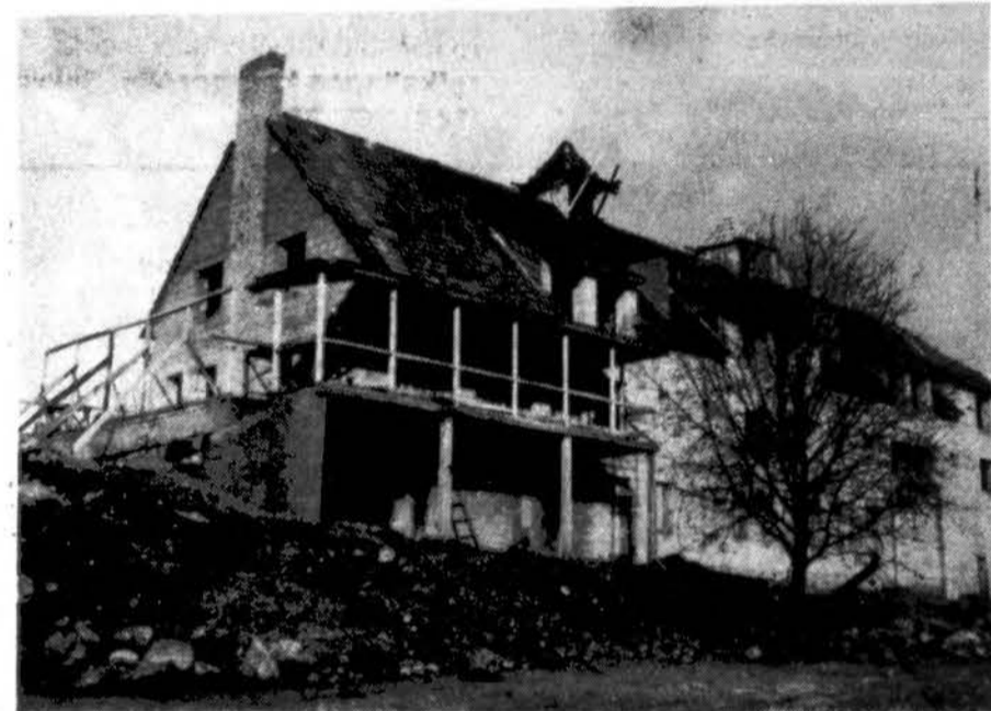
Būsimieji Rietavo senelių namai.