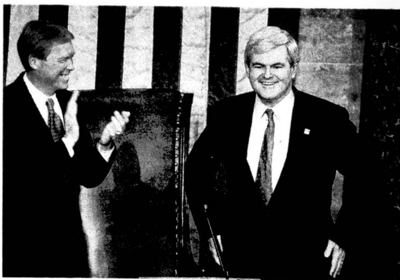
Naujasis JAV Atstovų rūmų kalbėtojas respublikonas Newt Gingrich priima ovacijas iš Atstovų rūmų narių, jų tarpe ir iš naujojo mažumos — demokratų vado Richard Gephardt. Trečiadienį pirmą naujo JAV Kongreso sesiją atvyko praėjusių rinkimų lapkričio mėnesį laimėtojai. Jų daugumą abiejuose Kongreso rūmuose pirmą kartą po 40 metų sudaro Respublikonų partijos nariai. Nors JAV Senato atidarymoje sesijoje, kuri buvo skirta naujų narių prisikidimui ir prakalboms, dalyvavo nedaug narių ir nebuvo balsuojama, Atstovų rūmuose buvo ir balsuojama, vykdam Respublikonų užsibrėžtą tikslą dėl kurio jie ir buvo išrinkti: mažinti valdžios vaidmenį Amerikos gyvenime.