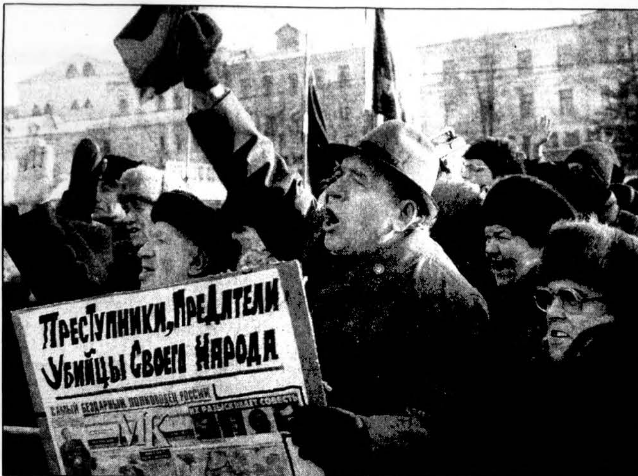
Maskvoje praėjusį sekmadienį žmonės protestavo prieš Rusijos veiksmus Čėėėnijoje. Plakate užrašyta „Priešai, pripažinkite ir žmogžudžiai savosios tautos“. Sekmadienį Grozne vyko aršios kautynės tarp rusų ir čėėėnų. Vienas Grozno profesorius pareiškė nusistebėjimą kodėl visas kultūringas pasaulis tyli ir nebando stabdyti „skerdynių“.

Jungtinių Amerikos Valstijų tylėjimas dėl šių (sutarčių) pažeidimų grasina pagrindiniam principui, kad žmogaus teisės yra visuotinės, galiojančios visur. Tiek Haityje, tiek Rusijoje, ir taip pat ESBK vadmeniu Europos saugumo struktūrose. JBANC baigia pareiškimą šitaip: „JAV privalo reikalauti, kad Rusija gerbtų Europos Saugumo ir Bendradarbiavimo Konferencijos principus ir sugrįžtų prie derybų su Čėėėnija, kad rastų smurto nenaudojantį sprendimą, kuris duos teisingą ir patvarią taiką“.