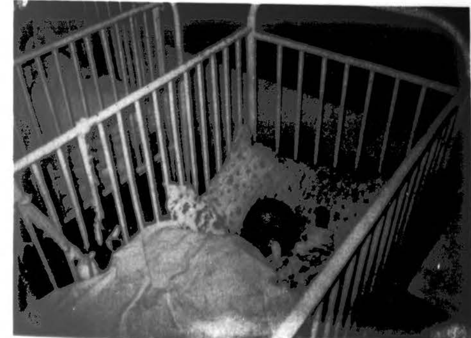
Mažylis lietuviukas gydomas Lithuanian Mercy Lift atsiųstais vaistais. Gaila, kad jo motina net du mėnesius „neranda“ laiko jį aplankyti.

ARAS ŽLOBA, M.D. AKIŲ CHIRURGIJA AKIŲ LIGOS Good Samaritan Medical Center- Naperville Campus 1020 E. Ogden Ave., Suite 310, Naperville IL 60563 Tel. 708-527-0090 Valandos pagal susitarimą