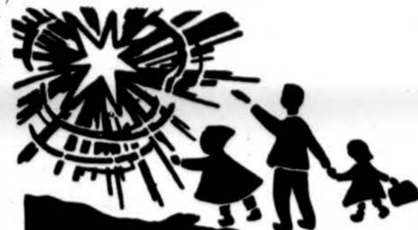
Redaguoja J. Pliacas. Medžiagą siūsti: 3206 W. 65th Place, Chicago, IL 60629

x LEMONTE, PL centre, TRANSPAK įstaiga veikia kiekvieną savaitę: penkt. 3 v. p.p. - 7 v.v., šešt. 10 v.r. - 3 v. p.p., sekm. 8:30 v.r. - 2 v. p.p. Tel. 708-267-0497 arba 312-436-7772. (sk)