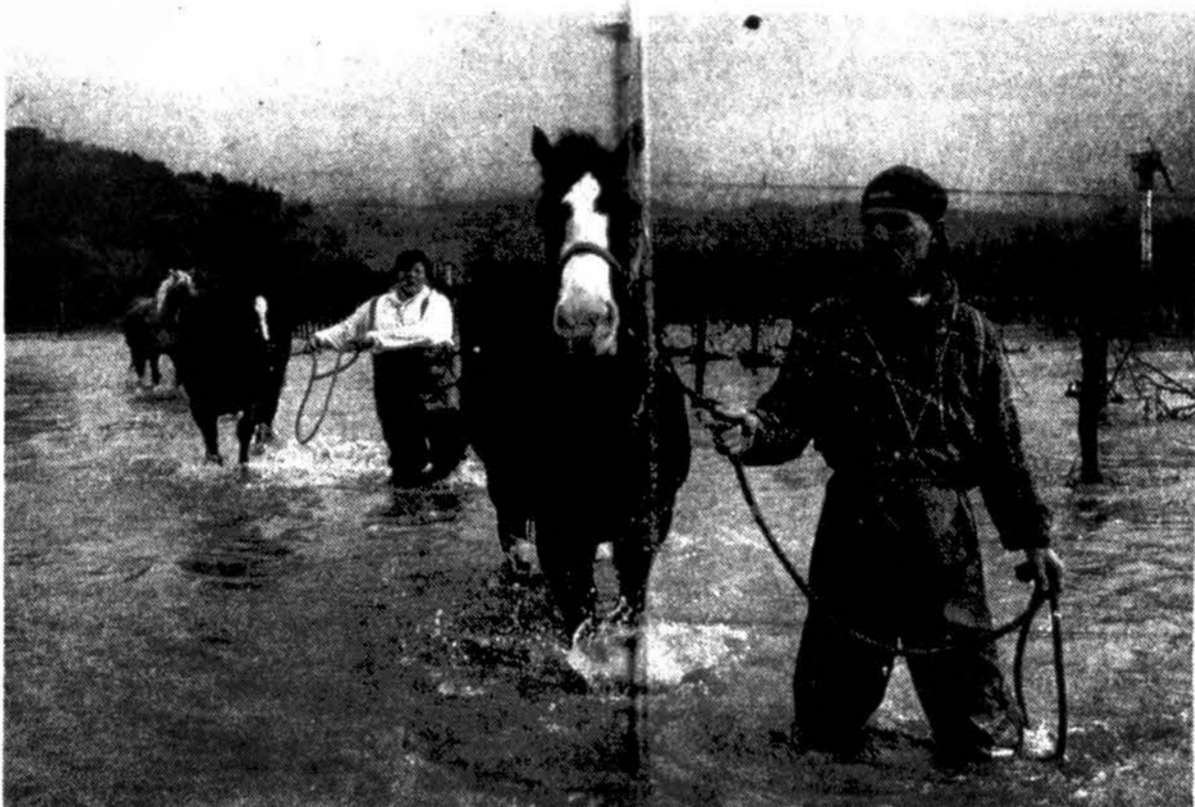
Tiek šiaurinėje, tiek ir pietinėje Kalifornijoje jau visą savaitę nesiliaujančios rekordinės lūšys patvindė miestus, kelius ir laukus, sukėlė purvo grūtis, kurios užvertė namus ir kelius, nusinešdamos ant jų stovėjusius namus. Oro pranešėjai dar nenumato jų galo. Stichinės nelaimės zonomis paskelbtos 24 apskritys. Apsemti vynuogynai Sonoma apskrityje šiaurinėje dalyje, nepaprastai greitai. Jau žinomi du, žuvusieji potvyniuose. Žmonės ir gyvuliai evakuojami laivais, sunkvežimiais, lėktuvais, malūnsparniais. Čia, šiaurinėje Kalifornijoje į saugesnę vietą vedami arkliai.

Šių metų miesto valdybos veiklą tikrinusiai kontrolės tarybai pavesta tokius patikrinimus atlikti reguliariai.