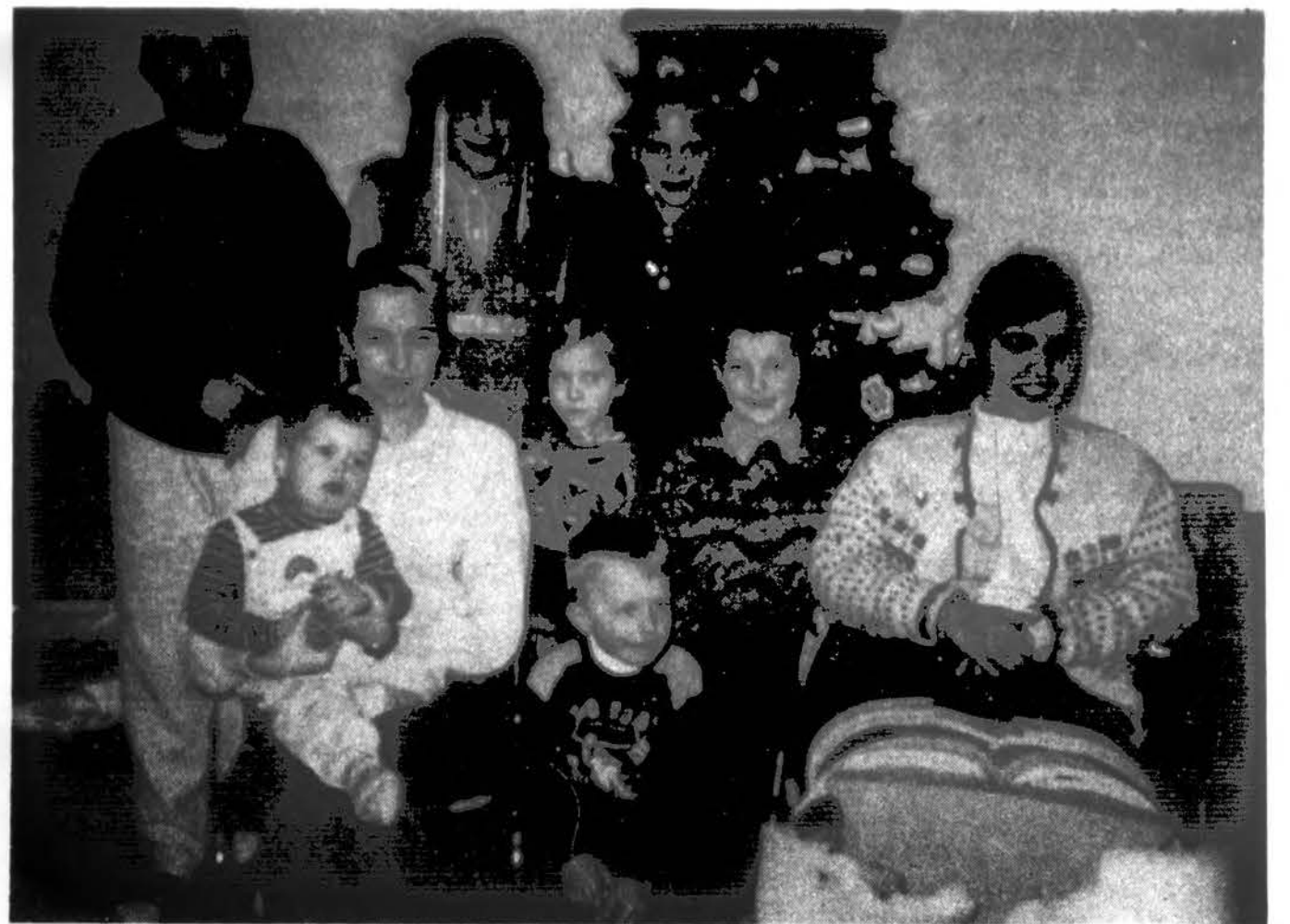
LVV globjami vaikai, besigydanys Shriners ligoninėje, kuriuos Kalėdų švenčių proga apdovanojo Lemonto Maironio liuanistinės mokyklos istorijos ratelio nariai.