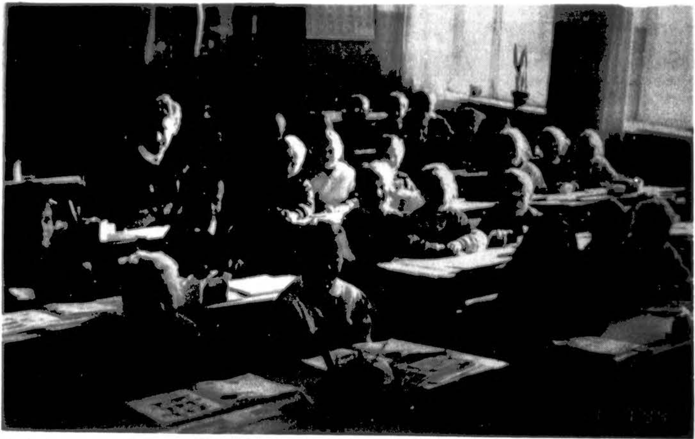
Rudaminos 2-sios vidurinės mokyklos klase su auklėtoja.