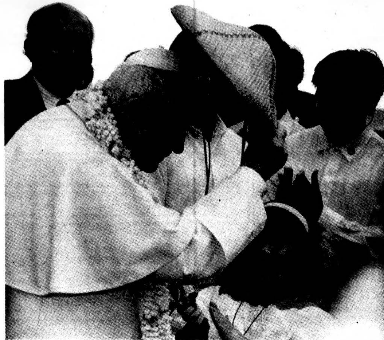
Ketvirtadienį Šv. Tėvas Jonas Paulius II atskrido į Manila, Filipinuose, pradėdamas 11 dienų trukmiančią kelionę į Azijos šalis ir Australiją. Matydami jį besiremiantį lazda, reporteriai jį paklausė apie jo sveikatą. Pasakęs „kas dar gyvas — pamatys“, jis pradėjo kalbėti apie planuojamas savo keliones į Belgiją, Slovakiją, Afriką, Austriją, galbūt Berlyną ir Ameriką. Jį pasitiko šimtai tautiniais drabužiais pasipuošusių šokančių mergaičių. Oficialiai jį pasitiko ir Filipinų prezidentas Fidel Ramos. Pagrindinis popiežiaus tikslas Filipinuose — dalyvauti katalikų Pasaulio Jaunimo Dienoje, kur jį pasitiks apie 500,000 jaunimo. Azijos šalyse, ypač Kinijoje ir Vietname, jis sieks, kad valdžios sumažintų apribojimus katalikams praktikuoti tikėjimą. Nuotraukoje popiežius užsideda jam dovanotą filipinietišką kepurę.

Kaip buvo pranešta verslininkų streiko komitete, atrodo, kad streikas mažiausiai jaudina miesto valdžią. Pas streikuojančius verslininkus nebuvo atėję ir jiems nesukamino ne tik vadovai, bet ir čia dirbantis vyriausybės atstovas Klaipėdos regione. „Klaipėdiškių prašymu leidome dirbti didžiausios valstybinės maisto produktų parduotuvės „Juodkrantė“, „Gausa“, „Vingis“, „Vytyrys“,