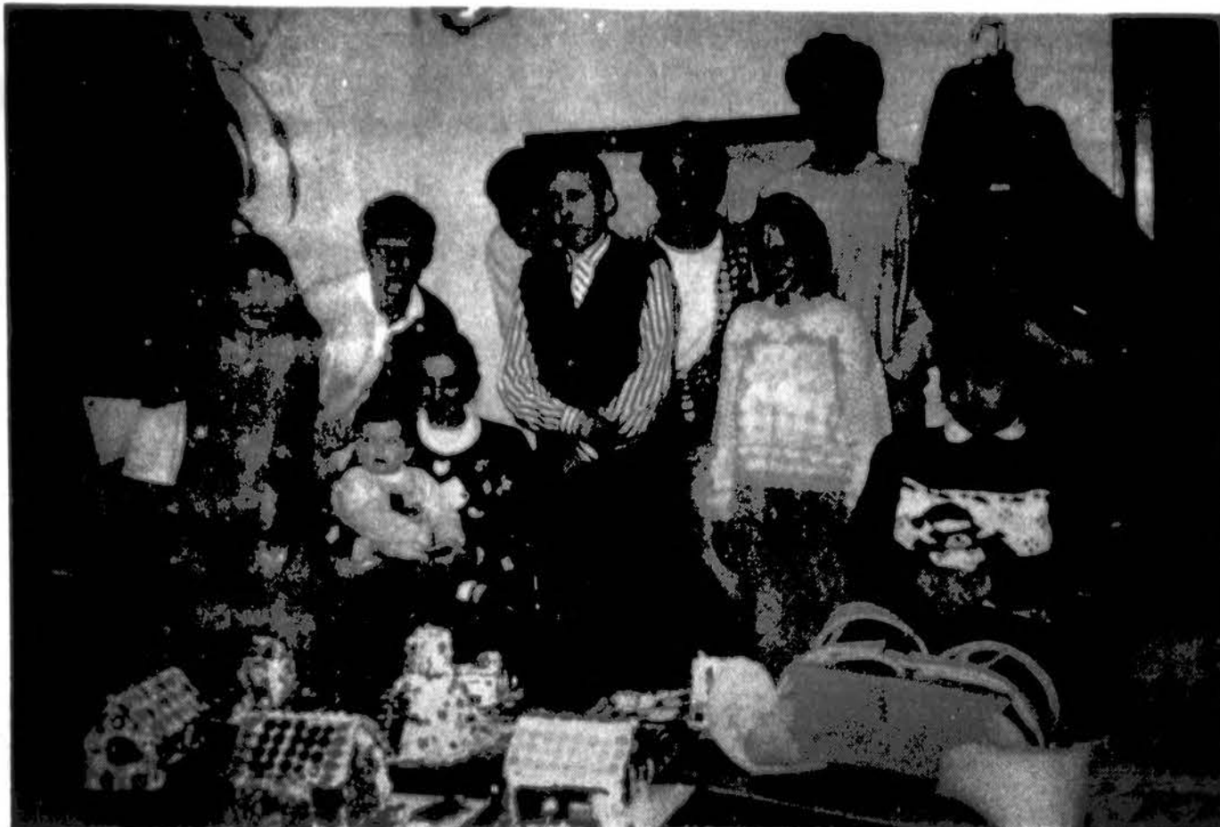
Čikagos moksleiviai ateitininkai Kalėdų proga aplankė „Lietuvos Vaikų Vilties“ globojamus vaikus, iš Lietuvos atvykusius sudėtingoms kūno operacijoms. Visi kartu pabendravo ir pastatė gražius saldinių namelius.