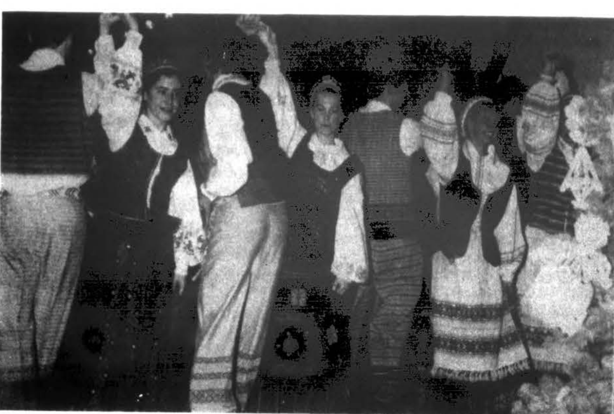
Lietuvos Vyčių tautinių šokių šokėjai Mokslo ir Pramonės muziejuje — „Kalėdos pasaulyje“ programoje — pernai gruodžio mėn.