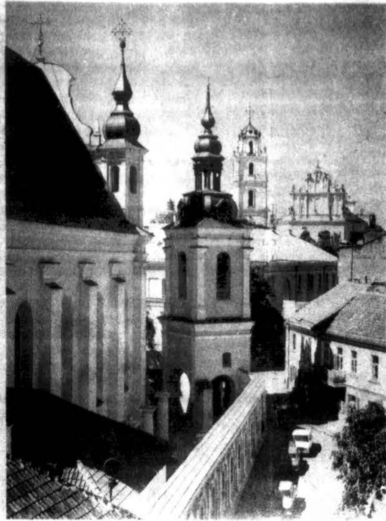
Šv. Mykolas bažnyčios bokštai Vilniuje.

Mes dar nežinome, koks turėtų būti didžiausias folinės rūgšties kiekis maiste, bet reikia manyti, kad padidinti kiekiai folinės rūgšties ir vitamino B12 būtų geros priemonės sveikatai palaikyti – tiek jauniems, tiek pagyvenusiems.