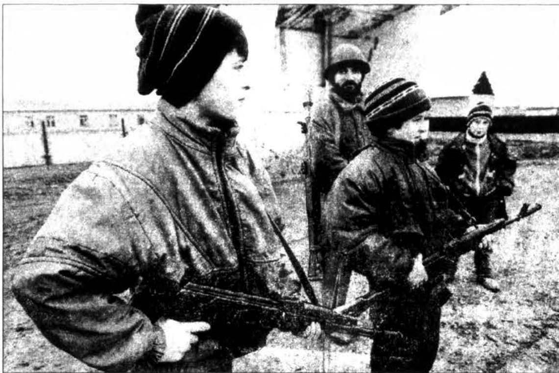
Kelią 15 mylių i vakarus nuo Grozno saugo ginkluoti čečėnai berniukai kartu su suaugusiais. Sekmadienį Grozne aršios kautynės tebevyko prie Prezidentūros rūmų, čečėnams vis dar atstumiant rusus nuo šio jų nepriklausomybės simbolio. Pirmadienį, išsiblaškius rūkiui, rusai vėl pradės bombardavimą iš oro. Sekmadienį rusai i Beslan, Osetijoje, pagaliau įsileido pirmą lektuvą su Jungtinių Tautų humanitarine pagalba pabėgėliams - 37 tonomis medicinos priemonių, antklodžių ir plastikinės dangos. Apskaičiuojama, kad dėl karo atsirado 300,000 pabėgėlių - maždaug ketvirtis šalies gyventojų. Manoma, kad Grozne liko 100,000 gyventojų iš buvusiu 400,000, dauguma jų rusai, neturintys kur kitur pabėgti.

kuo greičiau“, pažymėjo jis. „Tenka tik apgailestauti, kad i Lietuvos norą suteikti humanitarinę pagalbą karinio konflikto Čečenijoje aukoms atsakoma prasimanymais, kurie trukdo plėtoti draugiškus tarpvalstybinius santykius“, teigiama pirmadienį paskelbtame Lietuvos Užsienio reikalų ministerijos informacijos ir spaudos skyriaus pareiškime. Jame taip pat nurodoma, kad pastaruoju metu kai kurios oficialios Rusijos institucijos per visuomenės informavimo priemones pradeda skleisti dezinformaciją apie tariamą Lietuvos piliečių žvalgybinę veiklą Rusijos teritorijoje ir apie Lietuvos atstovų kišimąsi i Čečenijos konfliktą. Pasak pareiškimo, Lietuva yra ne kartą pareiškusi, jog Čečenijos konfliktą reikėtų sureguliuoti taikiai.