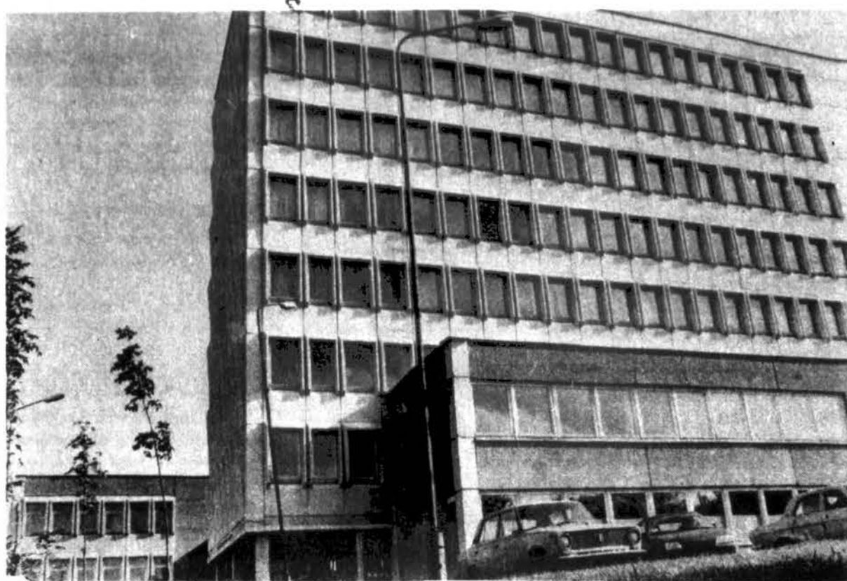
Aplinkotyros ir Informatikos fakultetai Vytauto Didžiojo universitete Kaune.

Mūsų universitetas ateity neturėtų labai išsiplėsti kiekybiu požiūriu, turėtų apsiostoti ties 3,000 studentų. Steng-