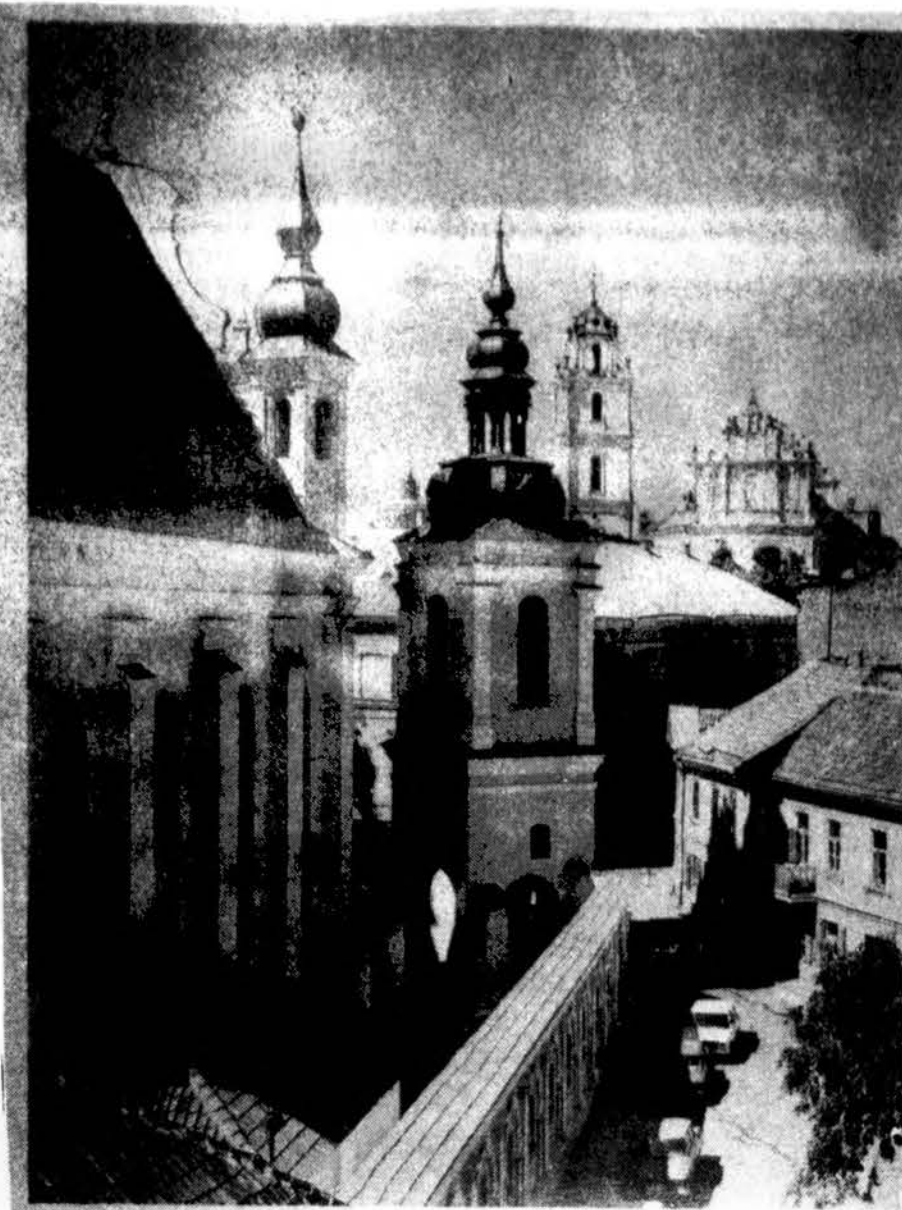
Šv. Mykolas bažnyčios bokštai Vilniuje.

Mes dar nežinome, koks turėtų būti didžiausias folinės rūgšties kiekis maiste, bet reikia manyti, kad padidinti kiekiai folinės rūgšties ir vitamino B12 būtų geros priemonės sveikatai palaikyti – tiek jauniems, tiek pagyvenusiems.