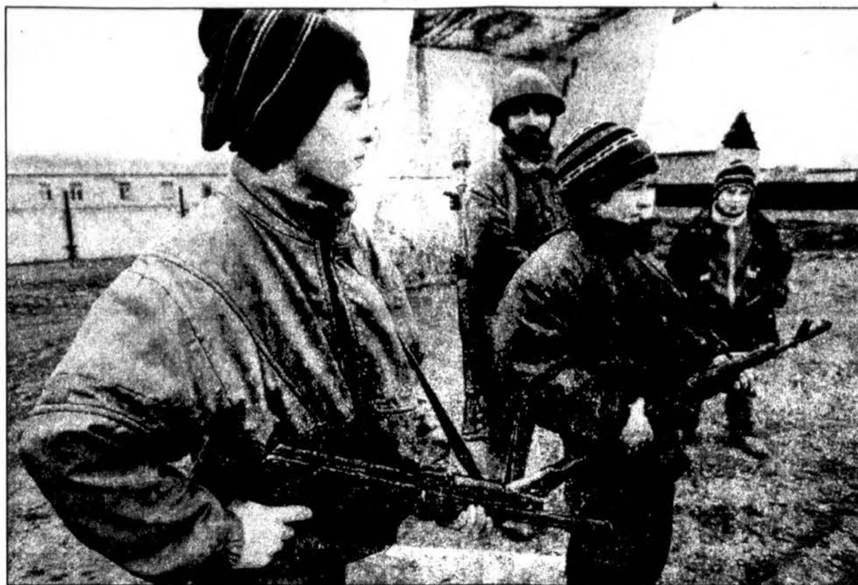
Kelią 15 mylių i vakarus nuo Grozno saugo ginkluoti čečėnai berniukai kartu su suaugusiais. Sekmdienį Grozne aršios kautynės tebevyko prie Prezidentūros rūmų, čečėnams vis dar atstumiant rusus nuo šio ju nepriklausomybės simbolio. Pirmadienį, išsiblaškus rūkiui, rusai vėl pradės bombardavimą iš oro. Sekmdienį rusai i Beslan, Osetijoje, pagaliau išleido pirmą lėktuvą su Jungtinių Tautų humanitarinę pagalbą pabėgėliams — 37 tonomis medicinos priemonių, antklodžių ir plastikinės dangos. Apekačiuojama, kad dėl karo atsirado 300,000 pabėgėlių — maždaug ketvirtis šalies gyventojų. Manoma, kad Grozne liko 100,000 gyventojų iš buvusių 400,000, dauguma jų rusai, neturintys kur kitur pabėgti.

kuo greičiau“, pažymėjo jis. „Tenka tik apgailestauti, kad i Lietuvos norą suteikti humanitarinę pagalbą karinio konflikto Čečėnijoje aukoms atsakoma prasimanymais, kurie trukdo plėtoti draugiškus tarpvalstybinius santykius“, teigiama pirmadienį paskelbtame Lietuvos Užsienio reikalų ministerijos informacijos ir spaudos skyriaus pareiškime. Jame taip pat nurodoma, kad pastaruoju metu kai kurios oficialios Rusijos institucijos per visuomenės informavimo priemones pradeda skleisti dezinformaciją apie tariamą Lietuvos piliečių žvalgybinę veiklą Rusijos teritorijoje ir apie Lietuvos atstovų kišimąsi i Čečėnijos konfliktą. Pasak pareiškimo, Lietuva yra ne kartą pareiškusi, jog Čečėnijos konfliktą reikėtų sureguliuoti taikiai.