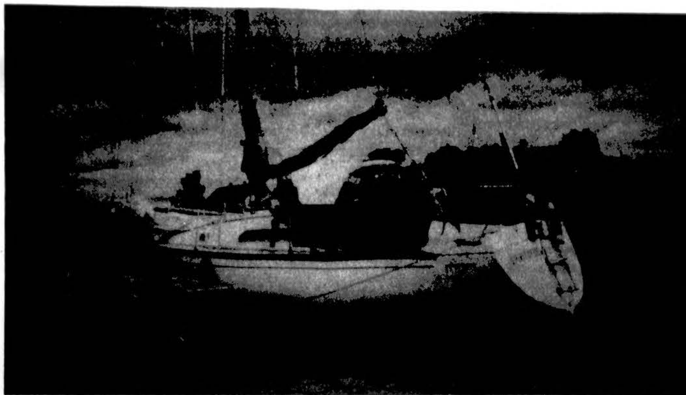
Olandijoje nupirkta lietuvių jachta.

1995 m. Š. A. Baltų ir Lietuvių Lengvosios Atletikos pir-