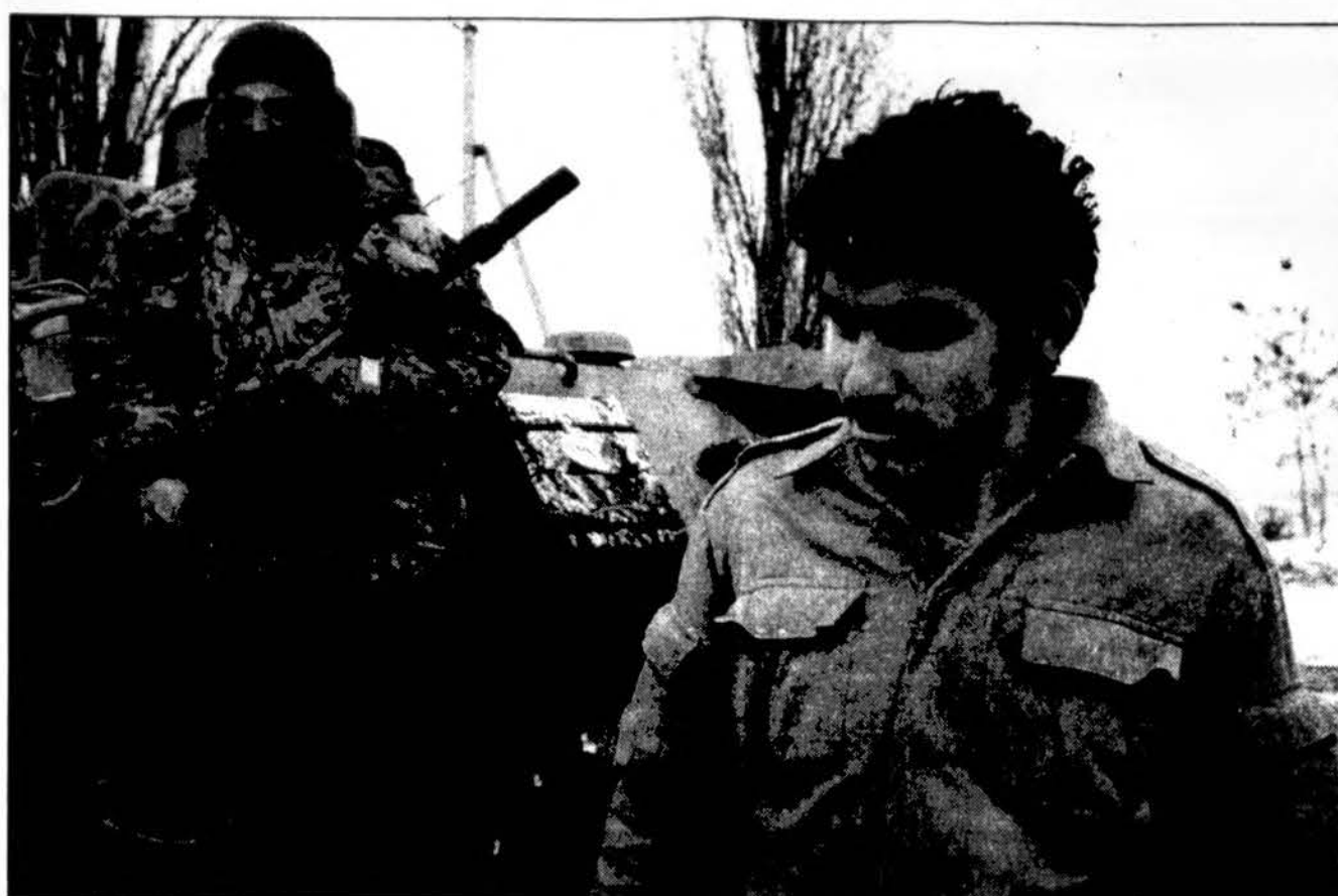
Čėčenijoje, Rusijos kontroliuojamoje teritorijoje esančiame Asinovskaja kaime įvyko pirmas šio karo belaisvių pasikeitimas. Į savo šeimą grąžintas 17-metis čėčenas, už jį atidavus sekmadienį čėčenų paimtą rusą belaisvį.

„Lietuvos aidui“ nepavyko sužinoti, kokios tos „papildomos priemonės“, kurių ėmėsi vyriausybė, „kad Lietuva koku nors būdu nebūtų įtraukta į karinį konfliktą“. Gal vyriausybė atstovs spaudai turi galvoje Rusijos jūrų pėstininkų permetimą iš Karaliaučiaus į Mozdoką per Lietuvą? O gal „raganų medžioklė“ pasienio policijoje? (Šiuo metu iškoma asmens pasienio policijoje, kuris pateikė informaciją apie Rusijos karinius krovinius, vežamus į Čėčeniją. - Red.)