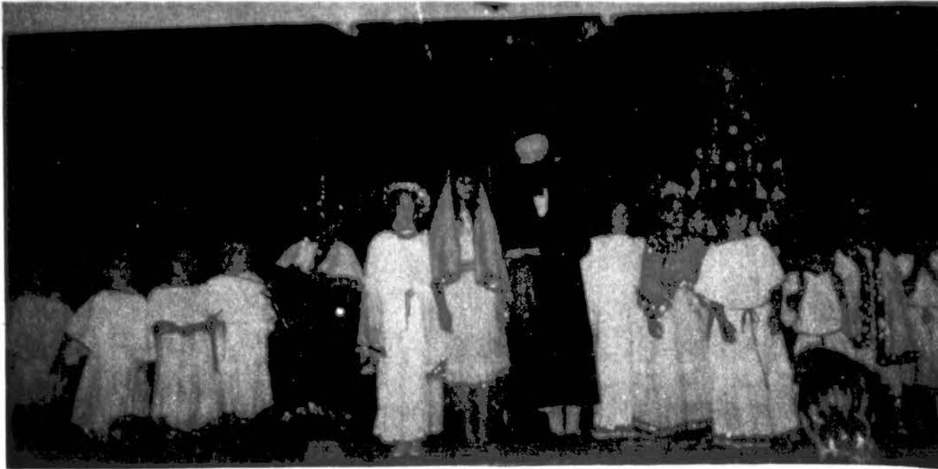
„Saulės“ lietuvištinės mokyklos St. Petersburg, Floridoje, mokiniai vaidinę kalėdinį vaizdelį „Kristaus gimimas“.