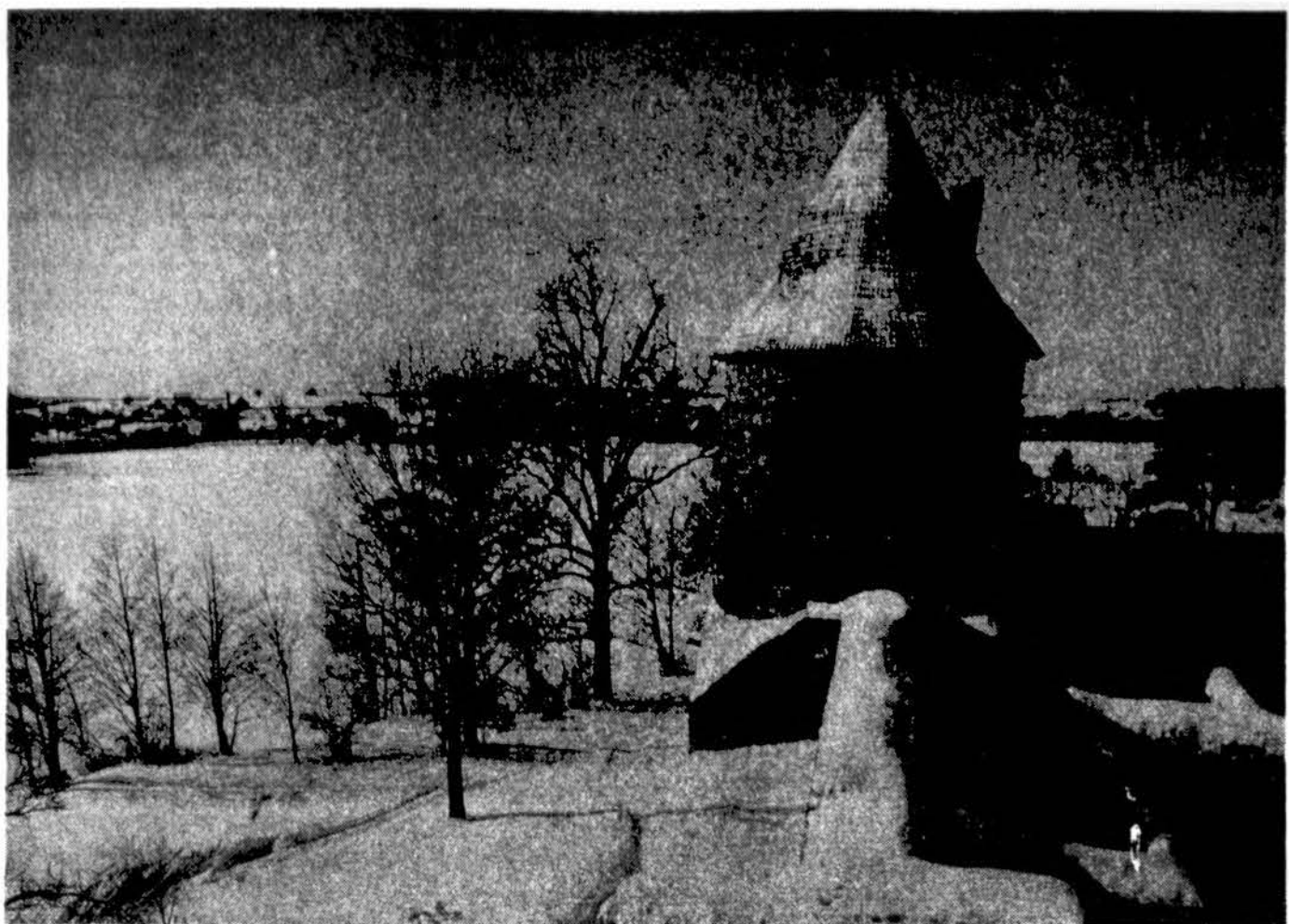
Trakų pilis žiema.