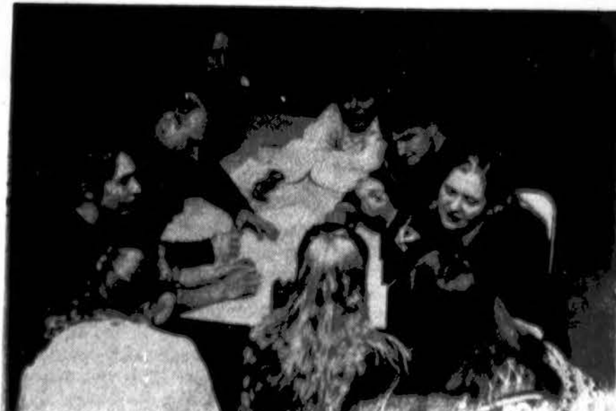
Studentai ateitininkai diaktuoja 1994 m. Dainavoje vykusiame SAS Žiemos akademijoje.