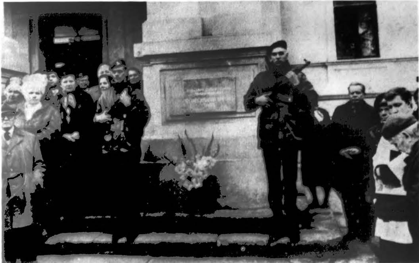
Tėvynės apsaugos rinktinės kūrimosi vieta įamžinta Pliuškės dvaro rūmuose.

• Gerald Ford, perėmęs JAV prezidento pareigas iš priversto atsistatydinti prezidento Richard Nixon, 1973 m. gruodžio 7 d. paskelbė jam amnestiją, dovandamas visus nusizengimus dėl Watergate įvykio.