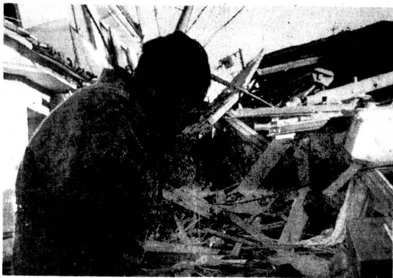
Kobe didmiestyje Japonijoje, kurį praėjusį antradienį sukrėtė stiprus žemės drebėjimas, moteris maldžiai prie vieno gyvenamo namo griuvėsių. Ketvirtadienį žuvusiųjų skaičius jau peršoko 4,000, 727 dar nerasti, o 275,000 liko be namų, ieškodami pastogės viešų pastatų salėse bei koridoriuose. Daugiau kaip 21,000 žmonės sužeisti, virš 30,000 pastatų apgriauti ar sugriauti. Labai sunku pristatyti vandens, maisto ir dujų šildymui ir bijoma, kad dėl to nekiltų panika, nors kol kas žmonės dar labai kantriai laukia ir stengiasi patys kiek galint tvarkytis, ieškoti ko galima griuvėsiuose. Savivaldybė pažadėjo pastatyti 2,000 laikinų namų, bet atrodo, kad to gali nepakakti. Žmonių nepasitenkinimą kelia valdžios nerangumas teikti pagalbą ar priimti ją iš užsienio, jos nepasirošimas tokiai nelaimėi, kai ypač Japonijoje buvo manoma, kad tam yra pasiruošta.

Tarp konstitucinių pataisų, kurios gali būti siūlomos 1996 metų konferencijoje, minimas valstybių veto teisės panaikinimas bei įvedimas tik kvalifikuotos balsų daugumos reikalavimo visiems ES sprendimams. Taip pat gali būti siūloma valstybėms priimti didesnius įsipareigojimus dėl vieningos Europos valiutos.