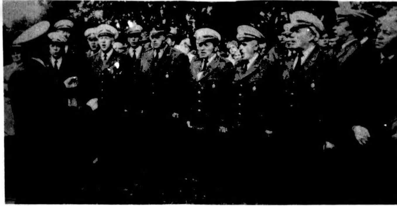
Palangos šaulių choras Sedos kapinėse gieda „Marija, Marija“, pagerbiant kapinėse palaidotus Tėvynės apsaugos rinktinės savorius.

Tiek Senajame Testamente, tiek ir Naujajame, Dievo žodis tegali būti suprasstas vieningoje bendruomenėje, nors jos nariai, kaip ir dera atviroje bendruomenėje, kuri pripažįsta skirtingų jos narių individualumą ir jų savito inšas į bendruomenę svarbumą, būtų ir labai skirtingi, tiek talentais — dovanomis, tiek ir tautybe. Anot šv. Pauliaus (1 Kor 12:12-30), „Mes visi