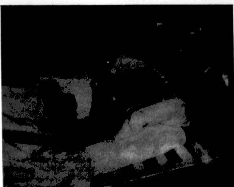
Šiuo metu Kauno infekcinėje ligoninėje tuberkuloze sergančių vaikų skaičius padidėjo iki 27. Čia matome vieną ligoniuoką. Vaikai gydomi Lietuvos Mercy Lift atsiųstais vaistais.

Vyresniems žmonėms, ypač daugiau nei 70 metų amžiaus, cholesterolio kiekis organizme natūraliai mažėja, be to, tokiam amžiuje jis kraujo indams nėra toks pavojingas kaip jauname amžiuje. Senstančio žmogaus arterijos tampa daugiau atsparios cholesterolio telkiniams, kurie jauno žmogaus arterijas sugadina.