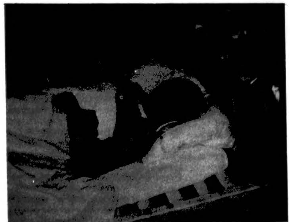
Šiuo metu Kauno infekcinėje ligoninėje tuberkuloze sergančių vaikų skaičius padidėjo iki 27. Čia matome vieną ligoniuoką. Vaikai gydomi Lithuanian Mercy Lift atsiųstais vaistais.

Vyresniems žmonėms, ypač daugiau nei 70 metų amžiaus, cholesterolio kiekis organizme natūraliai mažėja, be to, tokiam amžiui jis kraujo indams nėra toks pavojingas kaip jaunam amžiui. Stenčiantis žmogaus arterijos tampa daugiau atsparios cholesterolio telkiniams, kurie jauno žmogaus arterijas sugadina.