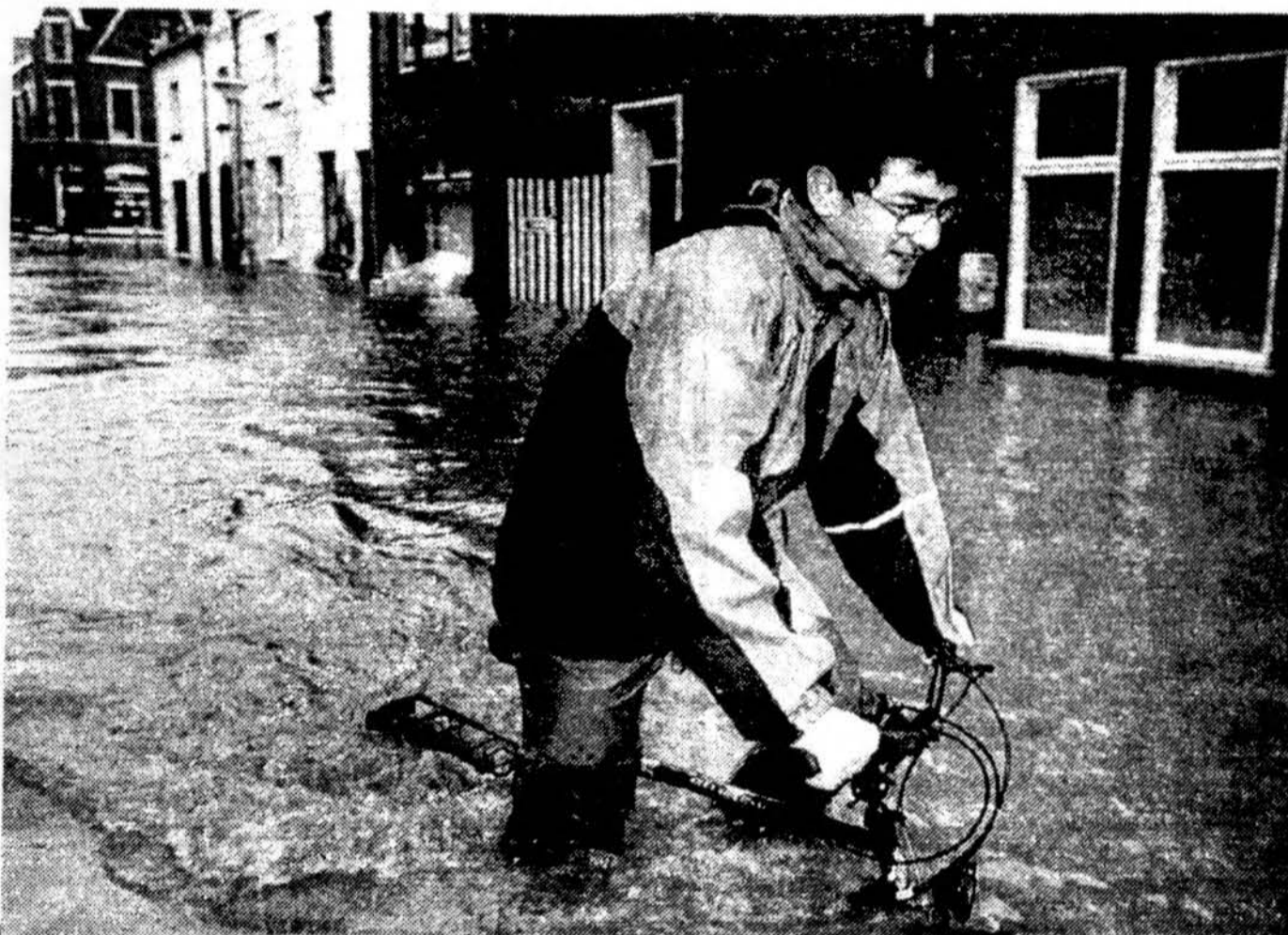
Prancūzijoje, Vokietijoje ir Olandijoje upės pakilo į rekordinį lygį, sukeldamos potvynius, kuriuose jau žuvo bent aštuoni žmonės. Venlo mieste, Olandijoje, vaikinai bando dviračiu važiuoti patvinsiomis gatvėmis. Paryžiuje Seine upė pakilus 13 pėdų virš normalaus lygio, daug žmonių negali išeiti iš savo namų, jiems laiveliais vežamas maistas ir gėrimai vanduo.

Trečiadienį delegacija susitiks su užsienio reikalų ministru Povilu Gyliu, kai kurių Seimo komitetų ir frakcijų nariais.