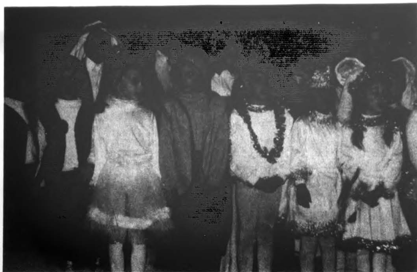
„Meškiukai“ ir „Snaigės“, be kurių neapsieitų nei viena mokyklos eglutės programa. Čia jie pasirodė Čikagos lit. mokyklos eglutėje pernai gruodžio mėn.

x Parduodame bilietus ke- lionėms į Lietuvą ir į visus pasaulio kraštus geriausiomis kainomis. Skambinti: T. Lesniauskienė, TravelCentre, Ltd., tel. 708-526-0773. (sk)