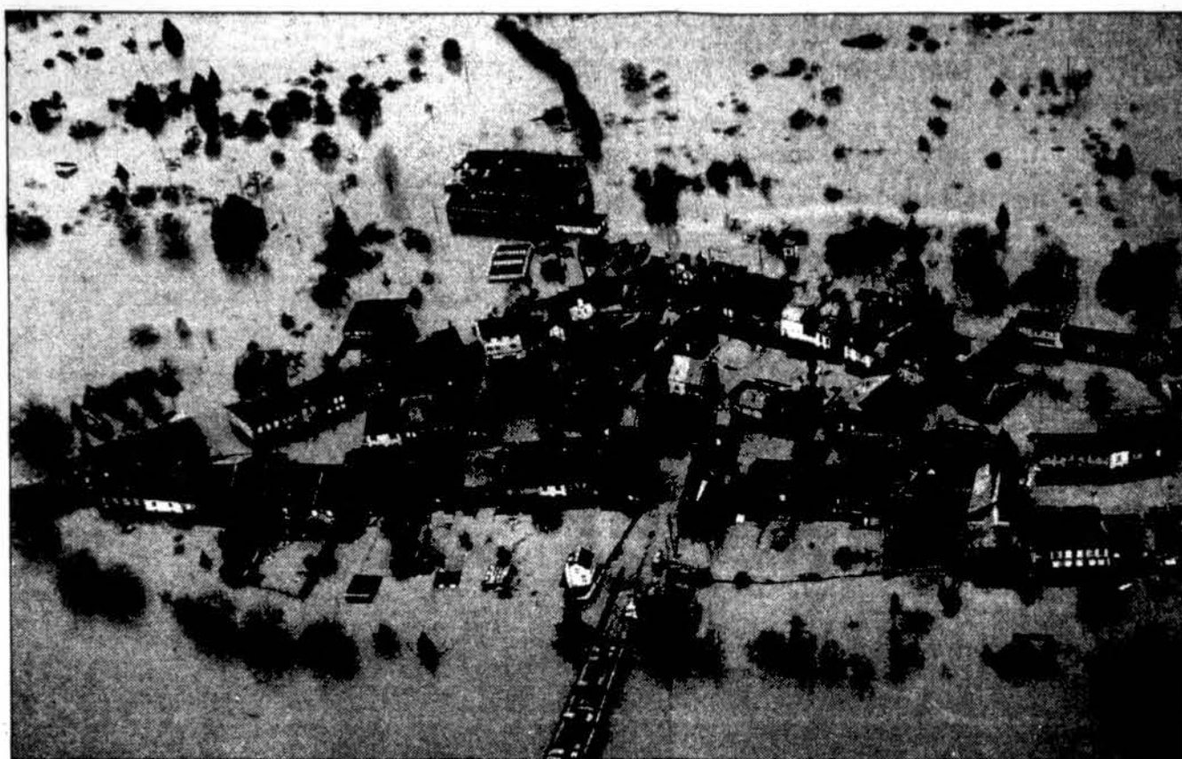
Nors trečiadienį jau pradėjo slūgti potvyniai Prancūzijoje ir Vokietijoje, šiaurietinės Prancūzijos kaimo Warcq gyventojai turėjo evakuoti kai Meuse upė išsiliejo iš krantų. Blogiausia, tačiau, Olandijoje, kur dėl upių išsiliejimo reikėjo evakuoti 250,000 žmonių. Tai didžiausia evakuacija dėl potvynių Olandijos istorijoje. Upės užlieja Europos miestus dėl tų pačių priežasčių kaip pernai vasarą tvino Missisipi upės slėniai. Dėl to, kad Reino ir į jį įtekančių upių pakrantės užtventtos pylimais, upė nebeturi kur išsilieti kai pritrivsta nuo lietaus. Iki šiol kiekviena valstybė norėjo pati spręsti kaip tvarkyti upių pakrantes, bet dabar, kai dėl potvynių sunaikinti kelių šimtmečių senumo istoriniai pastatai, ūkiai, kai sustabdyta pramonė, jau kuriama tarptautinė darbo grupė bendrai planuoti Reino ir į jį įtekančių upių tvarkymą.