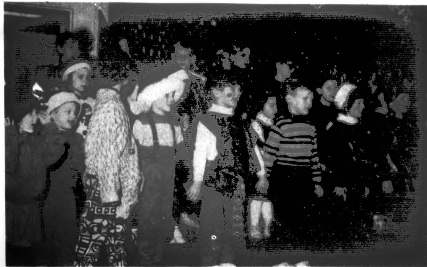
Maironio lit. mokyklos mokiniai Lemonte Kalėdų eglutės metu.

Sekmadienį, vasario 12 d., 10 val. r. vėliavų pakėlimas Švč. Mergelės Marijos Gimimo bažnyčios aikštėje. Apeigas praveda Vytauto Didžiojo šaulių rinktinės vadovybė su visų kuopų šauliais.