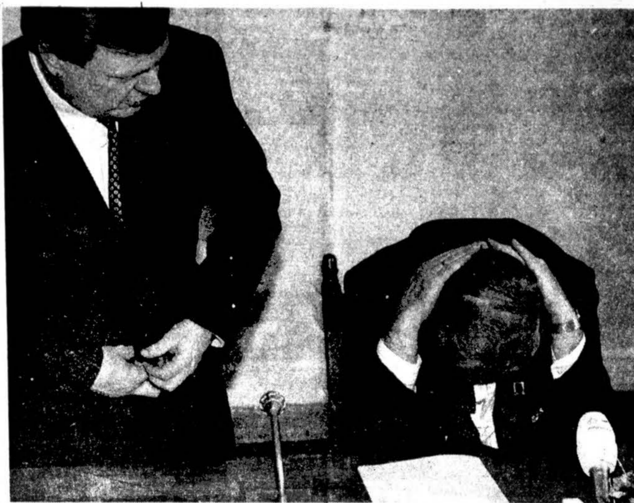
Lenkijos prezidentas Lech Wałęsa (dešinėje) minutę padėjo galvą prieš spaudos konferenciją pirmadienį, po to kai jis buvusių komunistų dominuojamo Lenkijos Seimo nariams įsakė sudaryti naują vyriausybę arba jis Seimą paleis. Jis nepatenkintas, kad vyriausybė sustabdė reformas ir nieko nedaro dėl plintančios korupcijos. Antradienio vakarą Lenkijos Seimo daugumą sudarančios partijos nominavo dabartinio Seimo pirmininką, buvusį Komunistų partijos ideologą Jozef Oleksy ministrų pirmininku. Tuo tarpu neaišku, ar ji patvirtins Wałęsą. Bet jam pavyko pareikalauti naujos vyriausybės dėl to, kad Seimo daugumos frakcijos vieningai nerėmė premjero Waldemara Pawlak. Lenkijos prezidento rinkimai numatomi šiais metais. Jei rinkimai vyktų dabar, Wałęsa juos pralaimėtų.