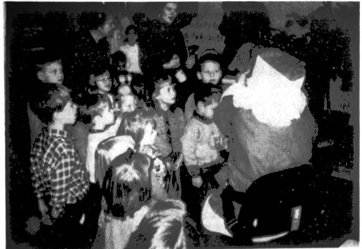
Populiariausias Kalėdų laikotarpio asmuo – Kalėdų senis. Čia jis apsilankęs Kriaučeliūnų vardo Vaikų nameliuose Čikagoje pernai gruodžio 18 d.