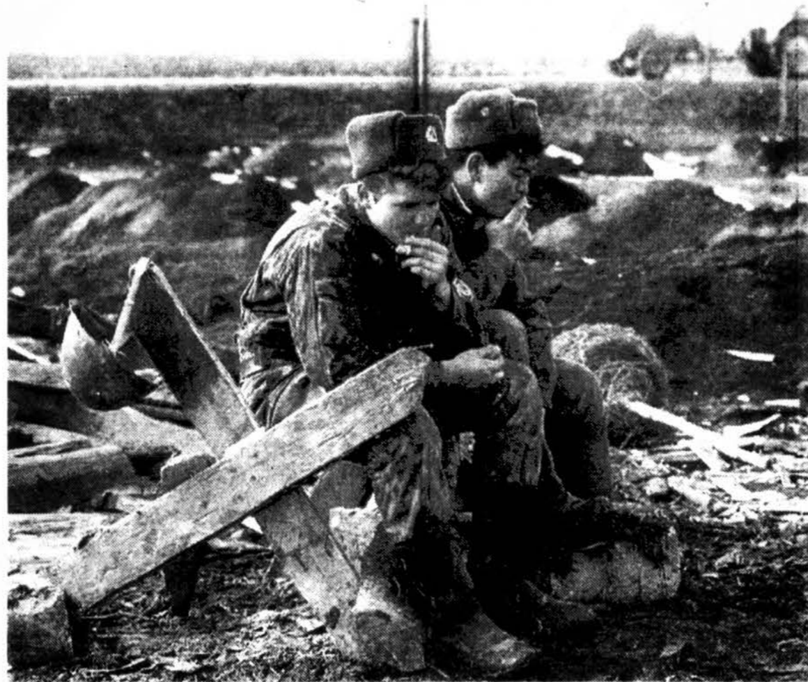
Čečenijos pasienių gyventojai ruošiasi galinčiam ir pas juos išsiplėsti Rusijos karui su Čečenija. Rusija jau bombardavo Ingušijos pasienio kaimą Arsty, pasiteisindami, kad tai — čečėnų kovotojų lizdas. Pirmadienį du rusai kareiviai išėjo į Čečenijos ir Ingušijos pasienyje.