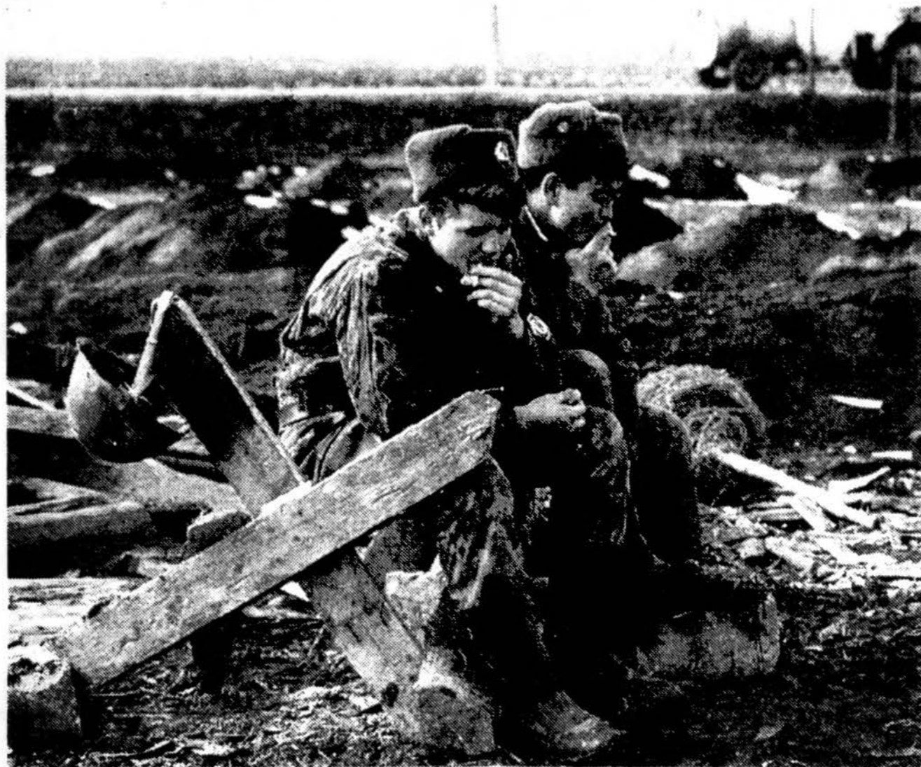
Čėėenijos pasienių gyventojai ruošiasi galinčiam ir pas juos išsiplėsti Rusijos karui su Čėėenija. Rusija jau bombardavo Ingušijos pasienio kaimą Arsty, pasiteisindami, kad tai — čėėenų kovotojų lizdas. Pirmadienį du rusai kareiviai išsėjęsi Čėėenijos ir Ingušijos pasienyje.