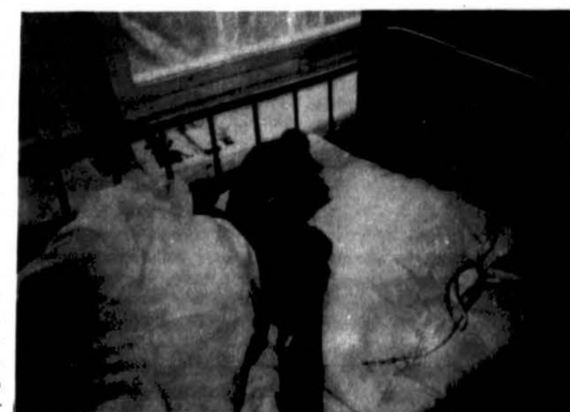
Devynmetė pacientė gydoma Lithuanian Mercy Lift atsiųstais vaistais Kauno infekcinėje ligoninėje.

Taip pat profesorius pažymi, kad vienas didžiausių rūpesčių yra organų aukotojai. Lietuvos žmonės kol kas nenoriai aukodami mirusių giminaičių organus. Lietuvoje iš kiekvieno milijono gyventojų per metus atsiranda 15 aukotojų, pasaulyje — 20. Nesulaukę operacijos, Lietuvoje per metus inkstų ligomis miršta apie 20-30 ligonių. Inkstų persodinimo operacija Lietuvoje kainuoja apie 10,000 dolerių. („Respublika“, 1995.1.17)