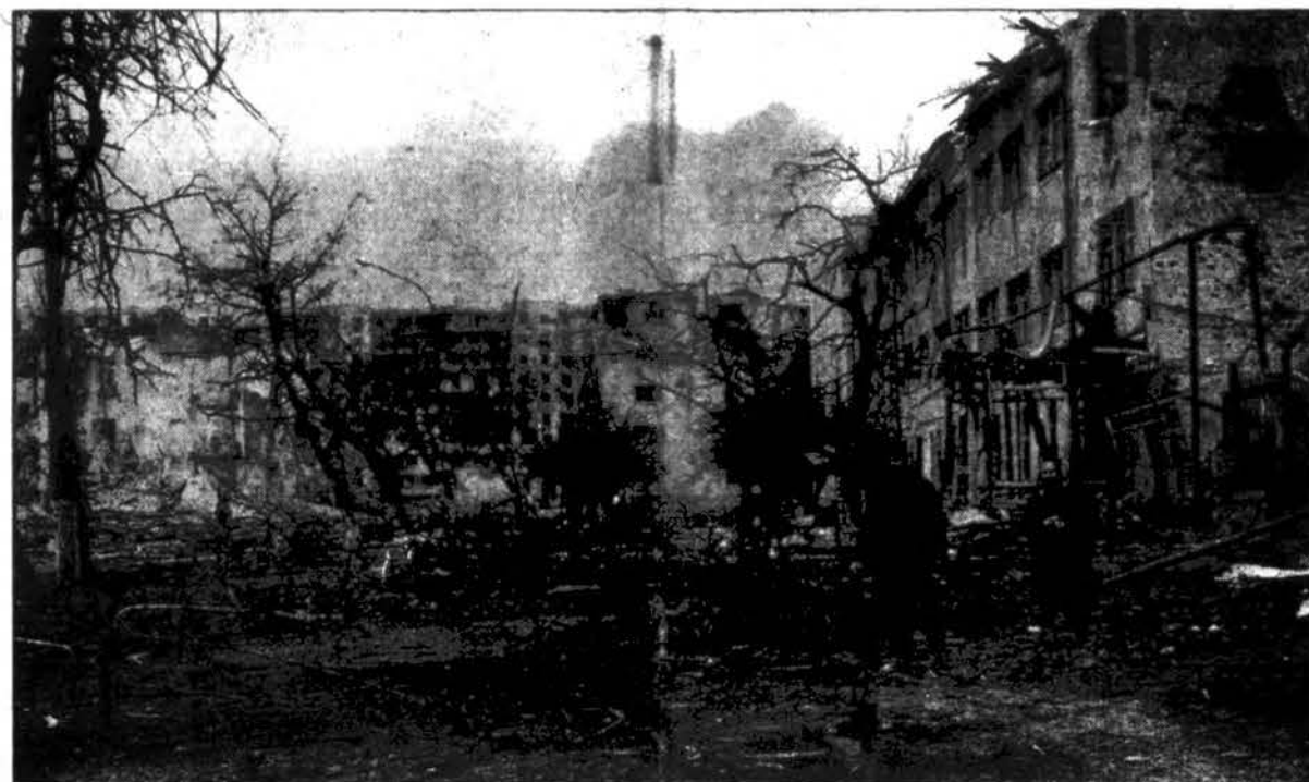
Grozno gyventojai vaikšto per griuvėsius, ieškodami savo buvusių namų. Nors Maskva Četėnijos sostinėje jau pastatė marionetinę vyriausybę ir tariai kontroliuoja Grozną, jos statybiniai nepajėgia kontroliuoti net savo kariuomenės bei vidaus ministerijos OMON dalinių. Jie plėšia ir žudo civilius, nepaisant, ar jie čekėnai ar rusai, ar Maskvos ar Dudajevio šalininkai. O Četėnijos rezistencija, kasdien auga, ir ją išjungiant vis daugiau žmonių, nukentėjusių nuo rusų „išvadotojų“. Sekmdienį čekėnai paskelbė, kad susprogdino 250 rusų užmuotojų raketų bazę netoli Grozno.