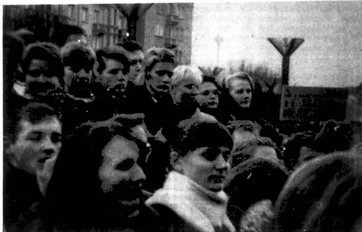
Jaunimas — Lietuvos ateitis — išreiškia nepasitenkinimą dabartinės valdžios vedama ekonomine ir administracine veikla, ypač studentų reikalų ignoravimu. Protesto susirinkimas įvyko pernai Vilniuje.