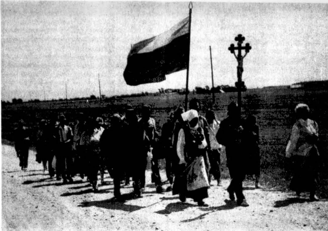
Su Dievo ir Tėvynės meile per Lietuvą...

Netrukus gegužinės, vasario 16-osios ir kiti minėjimai šioje mokykloje baigėsi. Dingo ir trispalvė nuo aukštaliemenio beržo. Į šią mokyklą raitais ir rogėmis iš valsčiaus atsidangindavo ginkluotų esesininkų lydimas storulis vokiečių su rinkti iš gyventojų pyliavų,