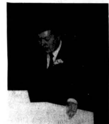
Lietuvos Respublikos gen. prokuroro pavaduotojas adv. Artūras Paulauskas kalba Vasario 16-tos minėjime, Detroito.

Adv. A. Paulauskas iš Detroito išvyko į Floridą, o ateinančią savaitę dalyvaus New Yorke, kur kalbės Vasario 16-sios minėjime.