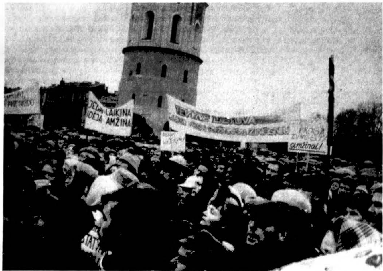
Pasisaikome už Nepriklausomybę... Vilnius, Katedros aikštė, 1988 m.