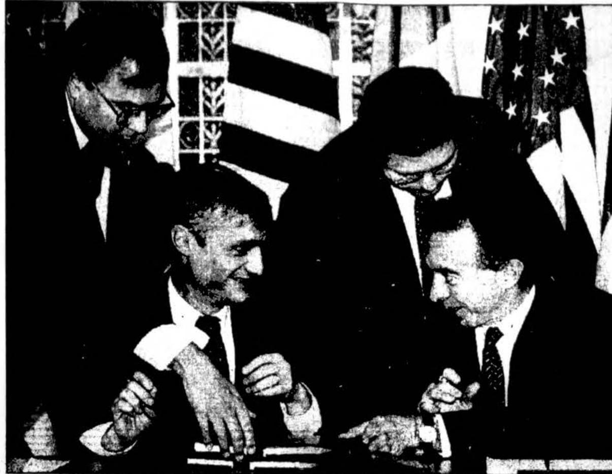
JAV izdo sekretorius Robert Rubin tariasi su Meksikos finansų ministru Guillermo Ortiz, antradienį pasirašius sutartį dėl Amerikos duodamos 20 milijonų dol. paskolos. Šiais pinigais Meksikos privatūs bankai bus gelbėti nuo bankroto. Paskolos tikslas – sustiprinti užsienio investuotojų pasitikėjimą Meksikos ekonomija, kad tuo būdu Meksika būtų išvesta iš finansinės krizės. Sutartyje nurodyti krašto ekonomijos suvaržymai tačiau gali įstūmėti ją į recesiją, nes įsakya, kad šių metų biudžetas privalo būti ne tik be deficito, bet dar ir su pertekliumi ir kad palūkanos būtų pakeltos aukščiau, negu infliacijos lygis.

Pasak Kohl, šis procesas vyks „žingsnis po žingsnio“, tačiau