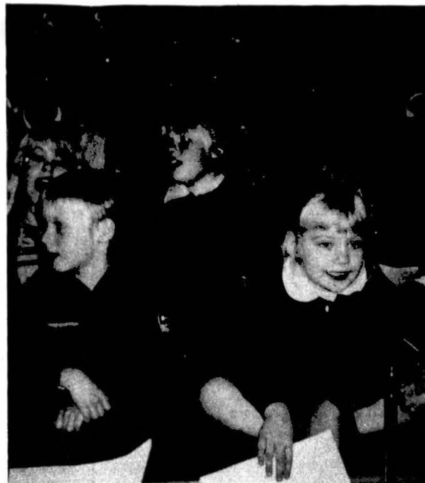
Philadelphijos skautų Kūčių sveigoje prie eglutės susirinkę kalėdines giesmes gieda jauniausieji „Laisvės Varpo“ vietininkijos nariai.

Vokietija iš savo pusės yra pasižadėjusi suteikti Vietnamui ekonominę pagalbą, per šiuos ir ateinančius metus, po 100 milijonų Vokietijos markių.