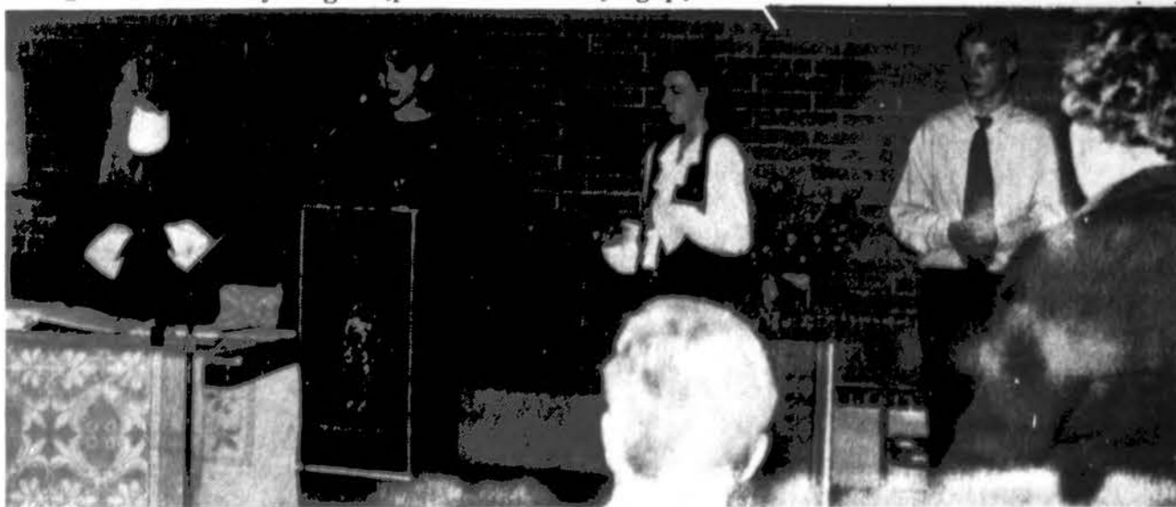
Susikauptimo dienos Clevelande šv. Mišiose skaitymus atlieka moksleiviai ateitininkai.