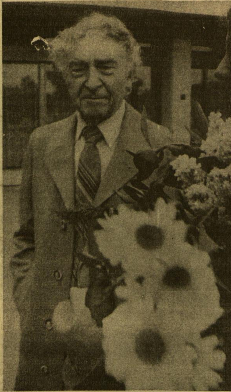
Šių metų vasario 2 dieną poetas Bernardas Brazdžionis šventė 88-ąjį gimtadienį.

Imperatoriai nebūtinai valstybes valdo, Ir išminčiai išmintį nebūtinai mum barsto, Admiralai plauko ne laivais, o geldom, O visiems visiems pakanka vieno — karsto.