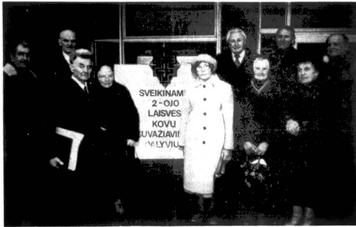
Laisvės kovų sąjungsos suvažiavimo dalyvių grupelė Radviliškyje 1992 m. balandžio 19 d.

Mūsų atsakymas aiškus, ir daug kam Lietuvoje jis aiškus. O kiti tegul apsisprendžia.