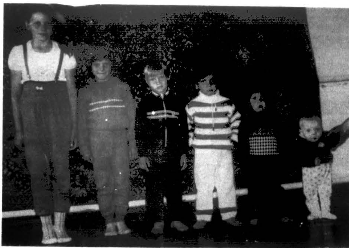
Tai senelio, grįžusio iš Sibiro, vaikų būrelis. Nuotrauka iš 1987 metų.